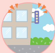
まど 窓ガラスや看板が お 落ちてきそうなビル