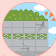
たお 倒れてきそうなブロック塀