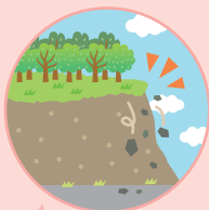
くず 崩れそうながけ