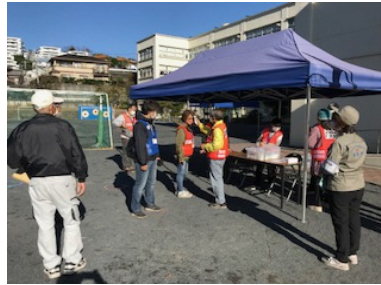
避難者受付・検温