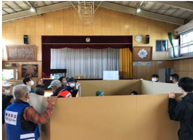
間仕切り・段ボールベッドの設置②