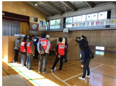
間仕切り・段ボールベッドの設置①