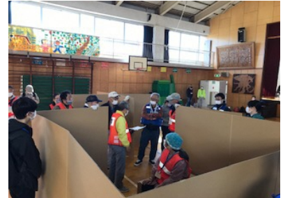
間仕切り・段ボールベッドの設置③