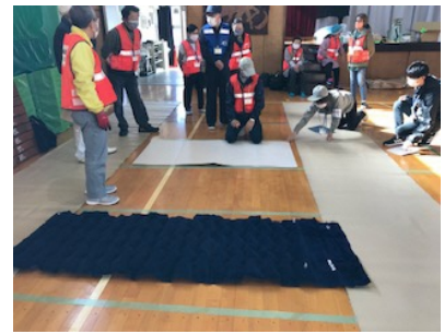
エアマットの設置