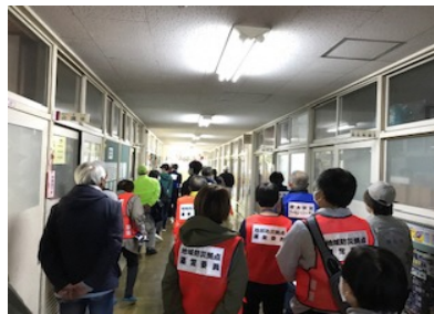
要支援者待機場所確認