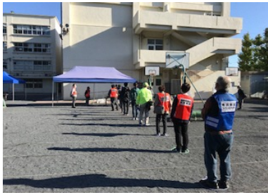
ソーシャルディスタンスを確保しての受付