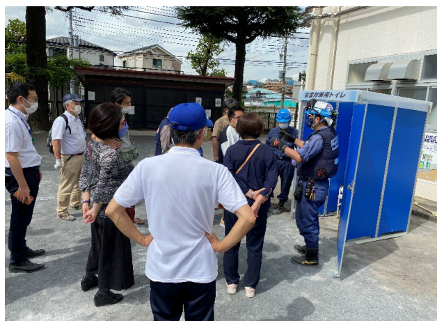
防災ライセンスリーダー指導員によるハマッコトイレ組み立て等指導