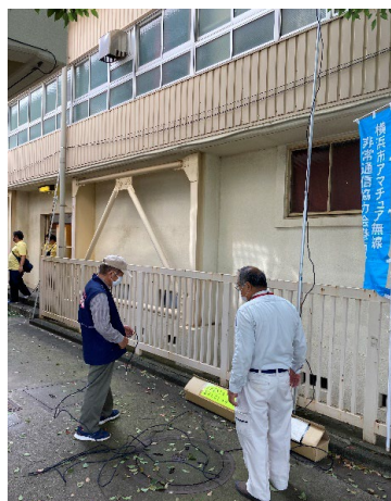
情報発信拠点訓練(無線、トランシーバー)