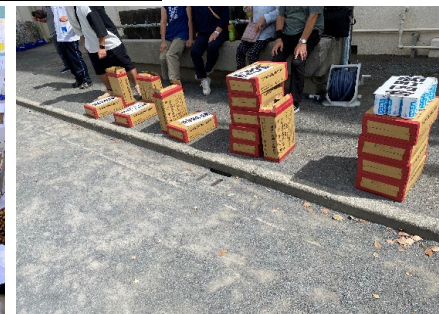
救援物資運搬訓練