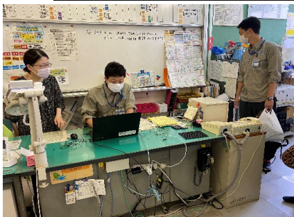
災害時安否確認システム入力