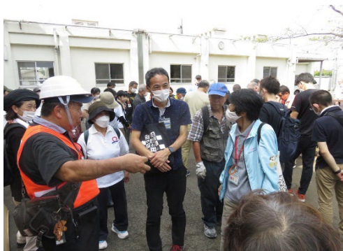
地域運営委員と区役所・ケアプラザとの打