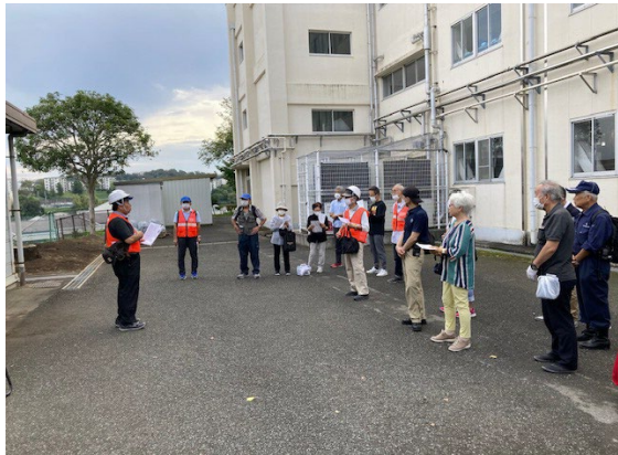
運営委員による打合せ