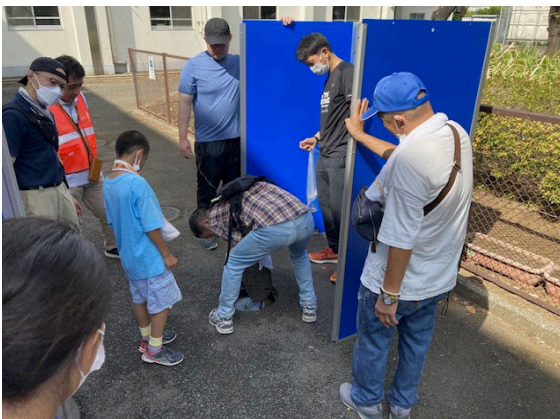
下水道直結式トイレ設置訓練