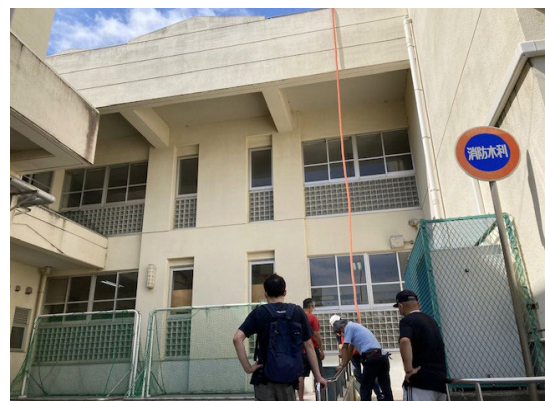
屋上プールからの給水訓