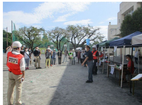
訓練開始時の説明