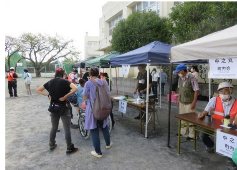
各町内会別の避難者受付テント