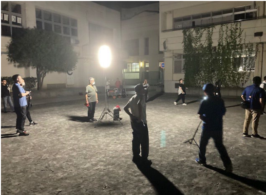
発電機(ガス)を使つての照明点灯訓練