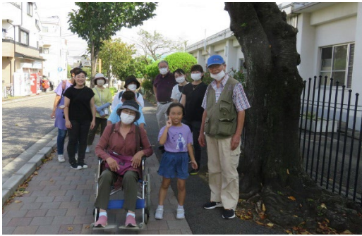
車いすでの避難者