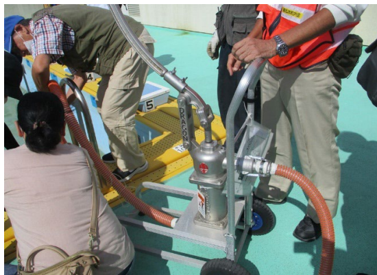
手押しポンプによる給水ホースでの送水