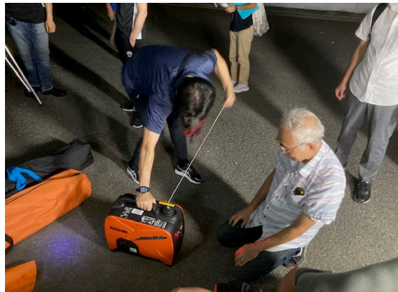
発電機(ガソリン)取扱いの訓練