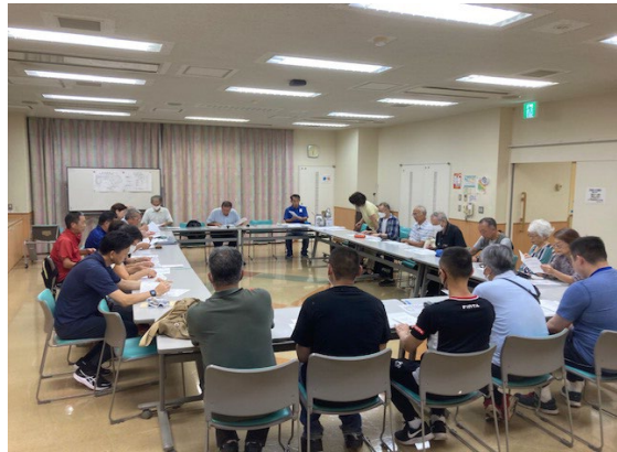
本日の夜間訓練の最終確認