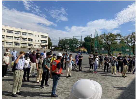
各町内会からの参集