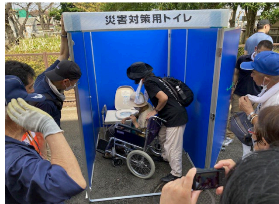
ハマッコトイレ内での介助について実践