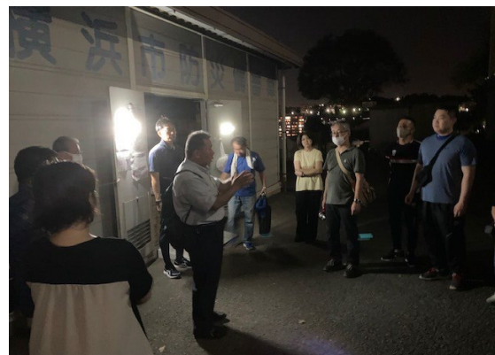
委員長による講評