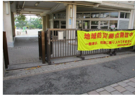
南台小地域防災地点の避難所タレ幕