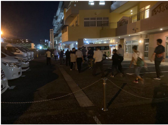
ランタンを持つての避難所への移動訓練