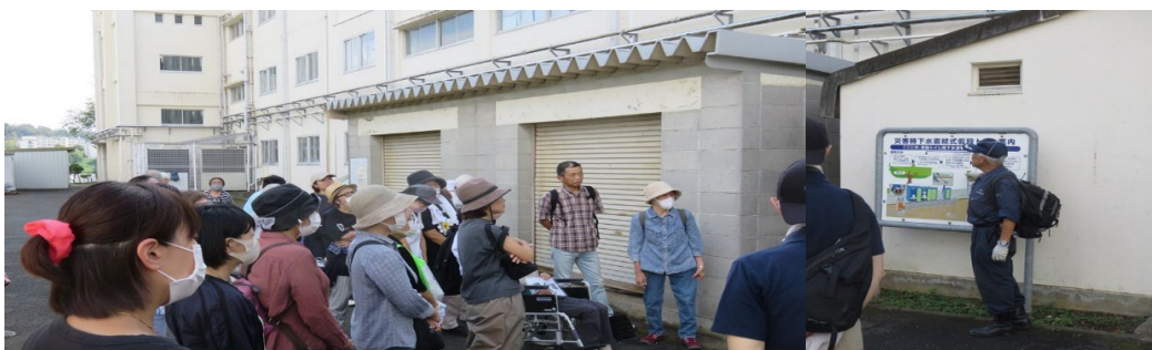
下水道直結式トイレ(ハマツコトイレ)の設置説明