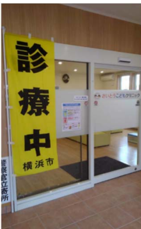
(さいとうこども クリニック)