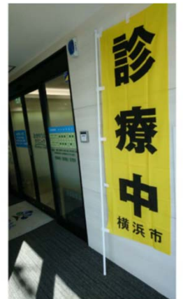
(おかのうえクリニック)