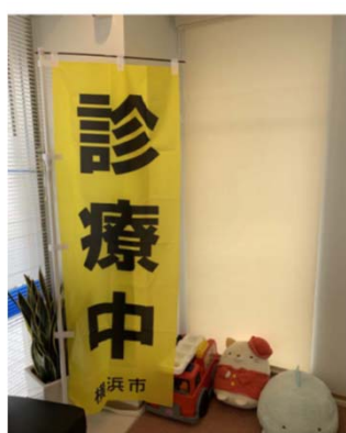
(上大岡パーク歯科 クリニック)