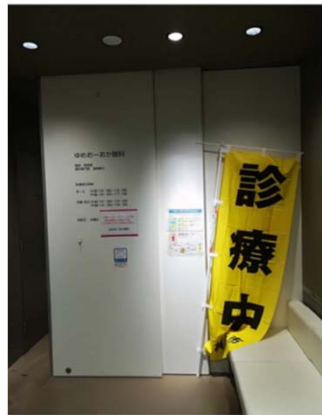
(ゆめおーおか眼科)