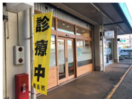
(つながるクリニック)