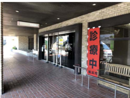
(済生会横浜市南部病院)

平成31年3月11日（月）（東日本大震災が起きた日）を含む、3月5日（火）～3月11日（月） の期間