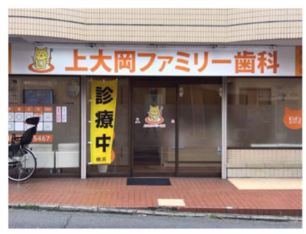
(上大岡ファミリー歯科)