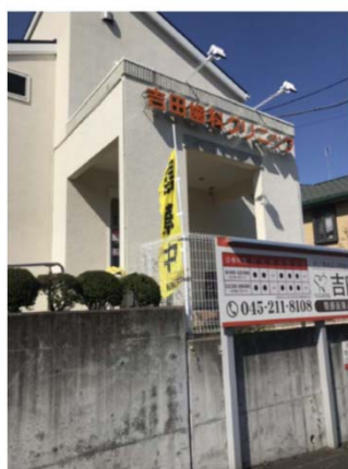
(吉田歯科クリニック)