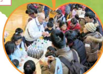
親子科学実験教室