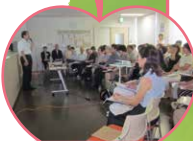
講演会「親なきあと」