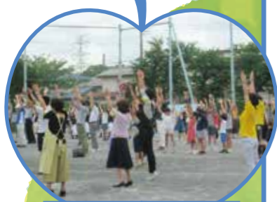
みんなでラジオ体操 (地域開発50周年記念式典)