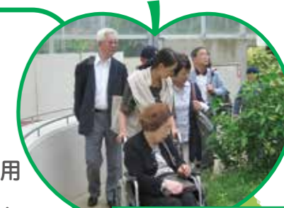
夢ツアー (大船フラワーセンター)