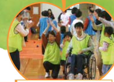
ふれあいスポーツふえすていばる