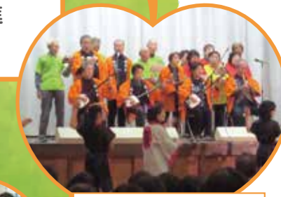
第16回ふれあいコンサート