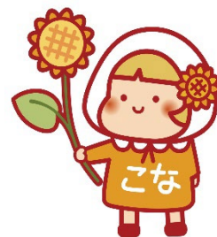
港南ひまわりプラン 推進キャラクター こなちゃん

「申請書類」や「申請の手引き」などは区福祉保健課及び区内地域ケアプラザ で配布する他、区ホームページにも掲載しています。