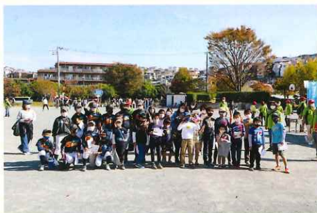
港南ひまわりピック2021参加者