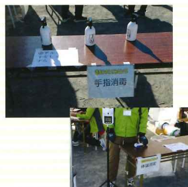
会場では検温、アルコール消毒を徹底しました▲

今回のひまわりピックは、コロナ感染拡大防止も意識したイベントとして、最大限の考慮をしました。おかげで、コロナ禍の運営の難しい中での実施としては、参加の皆様からも、実施運営した青少年指導員のメンバーからも高い評価を頂きました。参加した方々の笑顔が印象的なイベントとなりました。また、競技の様子は一部ライブ中継しました。今後さらに「青指」らしさを意識しつつ、もっと参加したくなる、もっとボランティアとして手伝いたくなるようなイベントにしていきたいと思います。皆さまのまたの参加をお待ちしています。