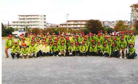
イベントを運営した港南区青少年指導員