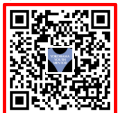
ボランティア 申込 QR コード

右のQRコードから申込フォームに必要事項を入力して送信ください 応募〆切：2月29日木 対象者：小6～中3生 活動内容：競技運営補助 活動：① 9:30～12:30 ② 12:30～15:30