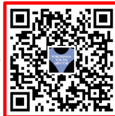
イベント参加 申込 QR コード

右のQRコードから申込フォームに必要事項を入力して送信ください 応募〆切：令和6年2月29日(木) 参加対象者：未就学児～小中学生 参加費：無料 当日は動きやすい服装で来てね。