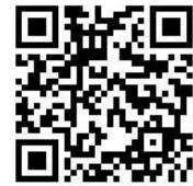
沐浴申込二次元コード

申込み: 沐浴申込二次元コードを読み込み、【初めての沐浴体験申込み】 フォームよりお申込みをお願いします。 参加希望日は複数申込みいただけますが、開催時間はこちらで 調整させていただきます。 また、申込み多数の場合は抽選となります。 抽選結果は、メールにてお知らせいたします。発表を過ぎても メールが届かなかった場合は、はっちまでお問合せください。 抽選の結果、ご希望に添えなかった場合は、資料を送付させて いただきます。