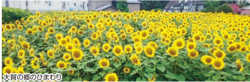
大賀の郷のひまわり

配布日 4月22日(月)から 配布場所 区役所5階54番窓口 配布数 200人(先着)、1人1袋(40粒程度)