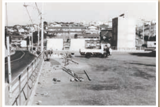
昭和50年代には、多くの住宅が建っているのが分かります

小学校は、3人とも永野小学校。野庭や芹が谷、山谷交差点(戸塚区)方面からも歩きやバスで児童が通い、雪の日などは10時や11時になってやっと学校にたどり着く子どもたちもいました。昭和40年代に開発が進み、住宅が次々とできました。後に開校した永谷小学校の10周年記念副読本は、永野小学校の児童の増加について「中永谷バス停を利用する児童だけでも160数名となり、一時に集まるので、通勤時間ともかさなって、とてもこんざつしました」と書いています。 地下鉄下永谷駅が開業したのは昭和60年(1985年)3月14日。皆さん「駅ができて、生活は一変しました」と言います。「今は上大岡、戸塚に湘南台、どこへ出るのも便利。それに静かで、場所としては一番じゃないかな」。