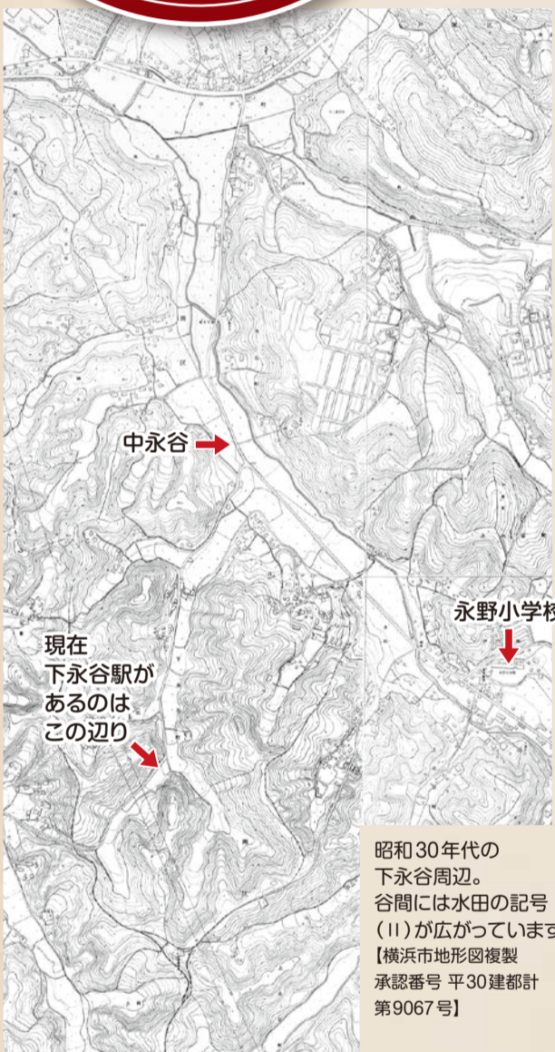
昭和30年代の下永谷周辺。谷間には水田の記号(II)が広がっています【横浜市地形図複製 承認番号 平30建都計 第9067号】