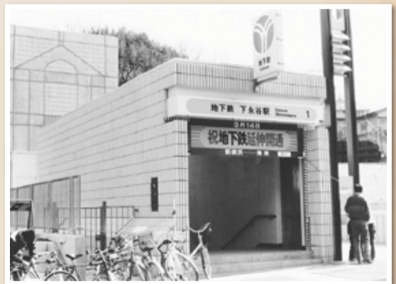
開業当時の駅出口

人口と世帯数 (平成31年3月1日現在) 人口…213,838人 (前月比 -8人) 世帯数…93,160世帯 (前月比 +87世帯)