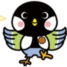
港南区ひまわり交流協会のマスコット「ティットくん」

港南区が誕生したのは、50年前の秋。今年は記念の年だから、区内のいろいろな所で、秋にもひまわりを咲かせる計画を立てているんだ。みんなにも協力してもらえるといいな。楽しみに待っててね!