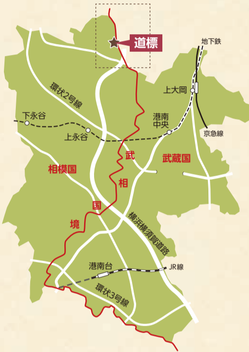
尾根伝いに続く武相国境は、武蔵の文化と相模の文化が交流する重要な交通路でした

港南区には、歴史を伝える数々の文化財があります。今月号からの地域通信では、歴史の専門家や地元の人などが文化財を訪ね、史実やエピソードを紹介し、文化財を通してまちの歴史に触れる、そんな散歩に出掛けてみましょう。