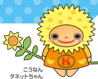
こうなん タネットちゃん

街のアドバイザーや活動グループ・団体を知るチャンス! サマーフェスティバルに行ってみよう!