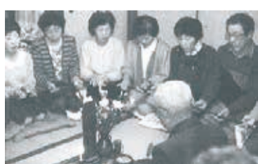
下永谷の念仏講 (港南の歴史研究会(現 港南区歴史協議会)著「ふるさと港南の石仏たち」平成3年2月1日発行から転写)