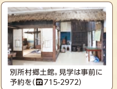
別所村郷土館。見学は事前に予約を(☎715-2972)

歴史資料室がある港南区の小学校 ※見学の申込みは各小学校へ ●日下小学校「郷土資料館」(☎843-7838) ●日野小学校「歴史資料室」(☎842-1118)