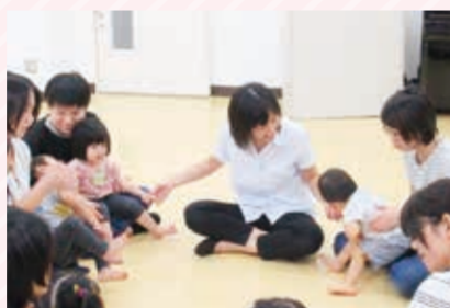
親子リトミック教室(芹が谷地域ケアプラザ)

遊びを通して子どもの心や体の成長と、親子や友達とのより良い関係づくりを目指します。音楽に合わせて体を動かしたり、歌ったり、楽器演奏をしたり、個々のペースに合わせた活動を行っています。