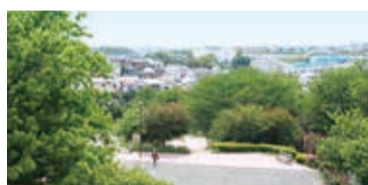
道標から200mほど北にある芹が谷一丁目公園。晴れた日には富士山が望めることも