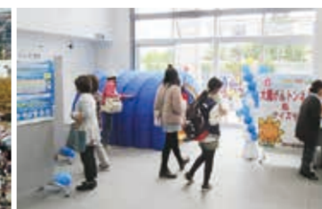
ひまわり健康フェア

当日の開催確認は 横浜市コールセンター (☎664-2525 ㊟664-2828、8時～)へ