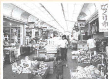
買い物客にぎわうせりぎんタウン(昭和57年5月撮影:横浜市史資料室所蔵)