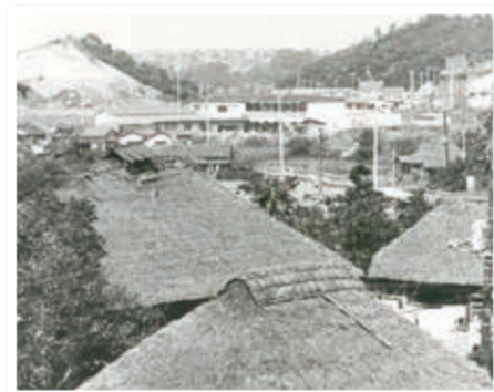
かやぶき屋根が残る日野周辺(昭和48年撮影:田野井一雄さん提供)