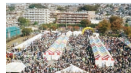
こうなん子どもゆめワールド