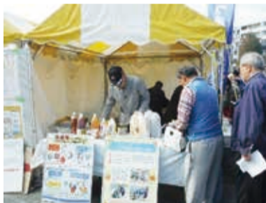
昨年の廃食油回収の様子

使用済みや期限切れの植物性食用油(廃食油)をペットボトルに入れて、当日会場へお持ちください。