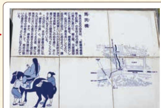
馬洗橋の説明看板