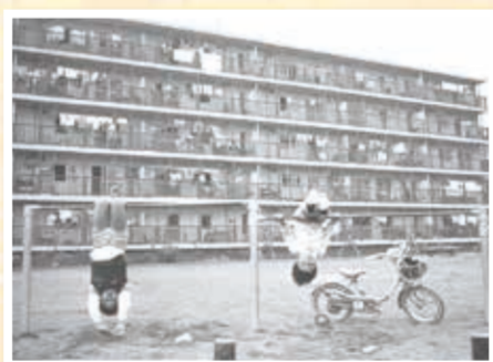
昭和48年に入居を開始した野庭団地(昭和51年10月撮影:横浜市史資料室所蔵)