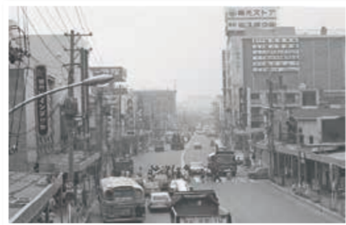
区誕生時の上大岡。ひときわ目立つ7階建ての上大岡センタービル(東光ストア)は昭和44年開店