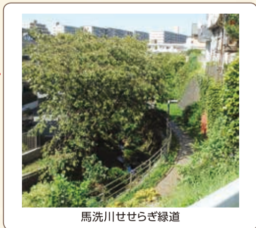
馬洗川せせらぎ緑道