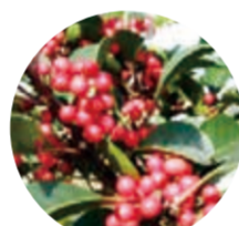
区の木 クロガネモチ