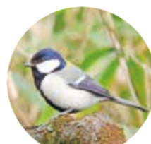
区の鳥 シジュウカラ