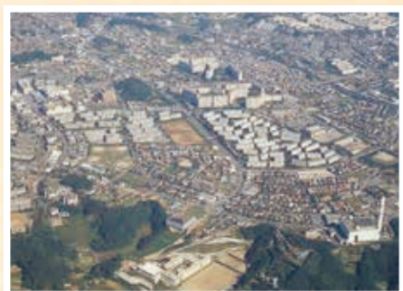
開発が進み、区第2の繁華街となった昭和59年の港南台駅周辺