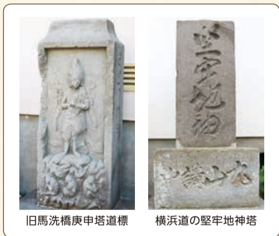
旧馬洗橋庚申塔道標

次に、石塔のある丸山台第2自治会館へ。旧馬洗橋庚申塔道標は、首部には右に日、左に月、主尊の青面金剛像は邪鬼を踏まえた六臂の立像で、中両手を合掌し、左上手に輪宝、右上手に矛、左下手に弓、右下手に矢を持ち、足下には2羽の鶏、邪鬼の下には三猿が彫られています。「この庚申塔は四角い箱に入っているのが珍しいですね。人間には3匹の悪い虫がいて、庚申の日に体から出てきて天にその人の悪口を告げるので寿命が縮まるといわれていたことから、みんなで鶏が鳴くまで夜通し起きていました。申の夜から酉の朝を無事迎えて、安心したんですね。この庚申講を60日に1回行っていました」と中本さん。側面には「右とつかみち、享保七壬寅天 相州鎌倉郡」、「左かまくらみち 上永谷村 庚申講中」とあり、道標の役割も果たしていたことが分かります。