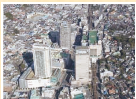
横浜南部地域の拠点に発展した平成26年の上大岡駅周辺