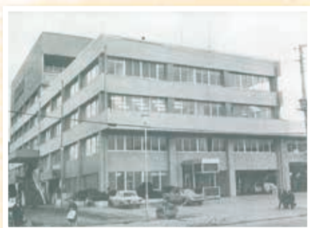
区誕生の2年後の昭和46年10月、港南区総合庁舎が落成