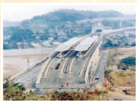
昭和51年9月、上永谷駅開設。平成5年のあぞみ野延伸まで、上永谷駅は唯一の地上駅(昭和52年11月撮影:港南図書館提供)