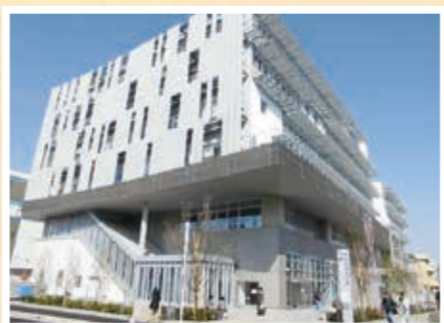
平成29年3月、現港南区総合庁舎が落成し、区役所・消防署が移転