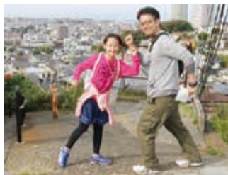
今年もスタンプラリーを行います。お楽しみに!