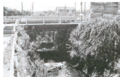
旧県道にあった馬洗橋

人口と世帯数 (令和元年9月1日現在) 人口…213,988人 (前月比-4人) 世帯数…93,971世帯 (前月比+28世帯)