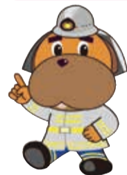
横浜消防マスコット キャラクター「ハマくん」

※高齢者のみの世帯を対象に、住宅用火災警報器の取付支援、防災訪問等を行っています