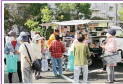
移動販売(野庭住宅)