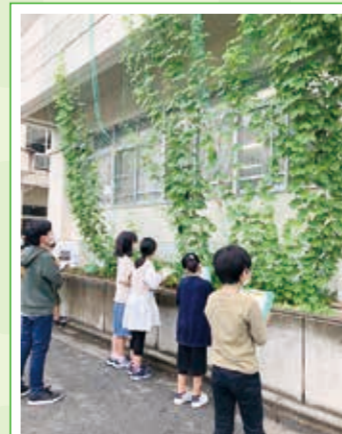
緑のカーテン育成の授業の様子(南台小学校)