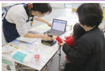
ベジメータ測定の様子

幅広い世代の健康づくり、切れ目のない子育て支援、 高齢者への支援、地域での文化・スポーツの振興