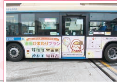
港南ひまわりプランプロモーション用ラッピングバス