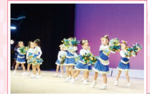
こうなん子どもゆめワールド