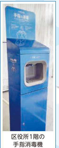
区役所1階の手指消毒機