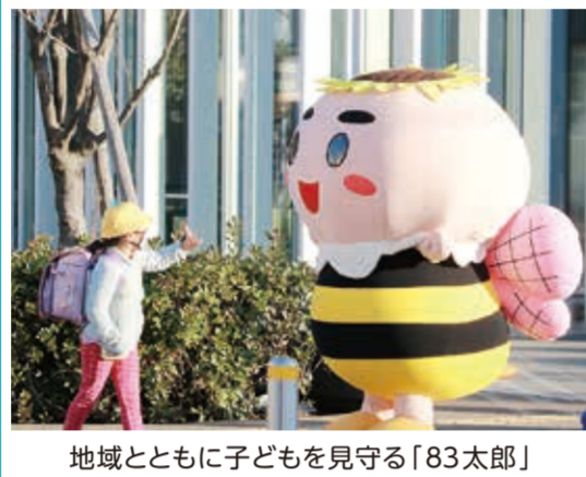
地域とともに子どもを見守る「83太郎」