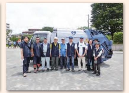
▲大岡川クリーンアップ(笹下地区)