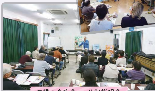
日限山自治会への分別説明会