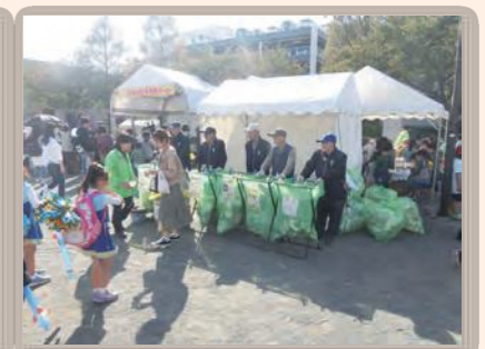
▲こうなん子どもゆめワールド