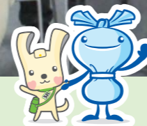
港南区環境事業推進委員連絡協議会