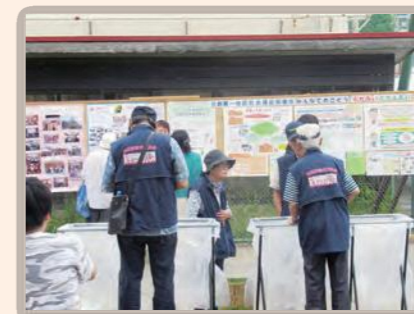
▲日野第一ふれあいフェスタ

地域の皆様が参加するイベントでは、ごみと資源の分別相談ブースの出展や、地域の皆様がお買い物に訪れるお店での店頭啓発活動などを通じて、地域の皆様にごみと資源物の減量化・資源化や、食品ロス削減・プラスチックごみ削減にさらなるご協力をいただけるよう、今後も地域に根付いた啓発活動に取り組んでまいります。