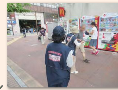
▲上永谷駅前プラごみ・ポイ捨て啓発