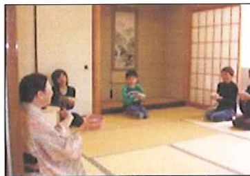
わんぱく 抹茶体験