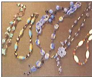
春の手作りアクセサリー