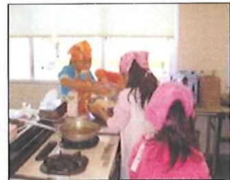
わんぱく バレンタインの生 チョコづくり