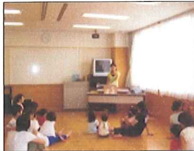
港南区「街の先生」の会タイアップ 体験講座 *親子リトミック*