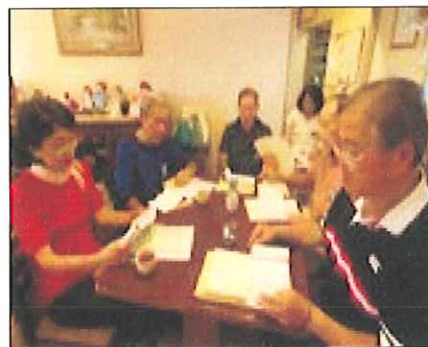
野庭をあ・じ・わ・う *地域の居場所づくり* 「歌声喫茶体験」