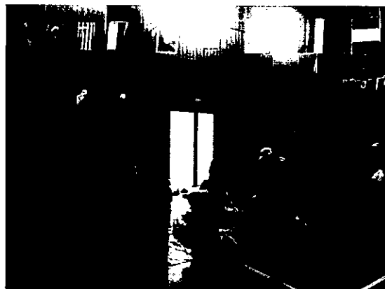
下野庭スポーツ会館まつり