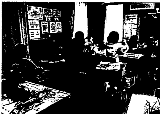
フラワーアレンジメント