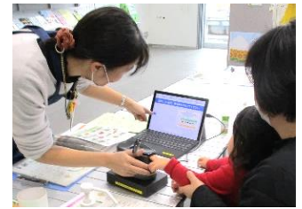
ベジメータ測定の様子

～幅広い世代の健康づくり、切れ目のない子育て支援、 高齢者への支援、地域での文化・スポーツの振興～