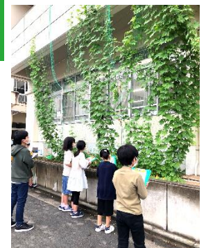
緑のカーテン育成の授業の様子

～街並みの美化、ヨコハマ3R夢プランの推進、階段や通学路など 道路環境の改善、温暖化対策、まちの魅力発信～