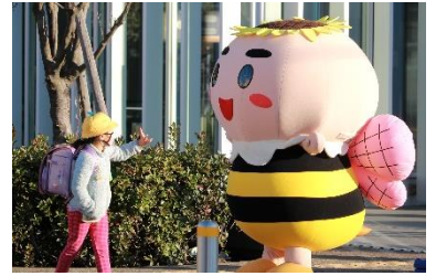
港南ひまわり83(ハチサン)運動 地域とともに子どもを見守る83太郎

～地震や風水害への対策、災害時要援護者の支援、 食品衛生やペットの相談、防犯・交通安全の推進～