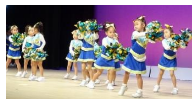
「こうなん子どもゆめワールド」の舞台発表 (Youtubeによる動画配信を行いました。)

「こうなん子どもゆめワールド」の動画配信では、会場の定員を大きく超える4,000人以上の方にご視聴いただき、遠方に住むご家族の方からも好評でした。令和4年度も引き続き、デジタル技術を活用し、工夫をしながら各事業を進めてまいります。