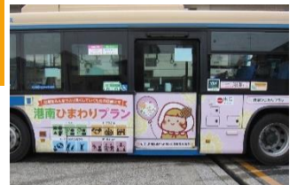
港南ひまわりプラン プロモーション用ラッピングバス

～地域での見守り・支えあい、障害理解の啓発、 自治会町内会運営のサポート、青少年の健全育成～