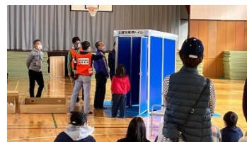
<地域防災拠点訓練の様子>