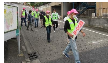
<防犯パトロールの様子>