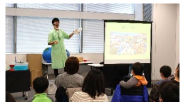
<環境学習講座の様子>