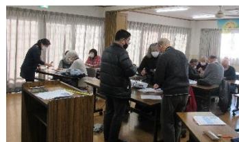
<自治会町内会向けLINE使い方講座の様子>