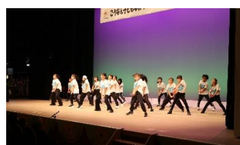
<こうなん子どもゆめワールドのステージ発表>