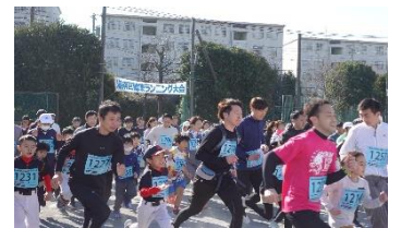
<港南区健康ランニング大会の様子>