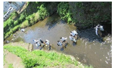
<河川のクリーンアップの様子>