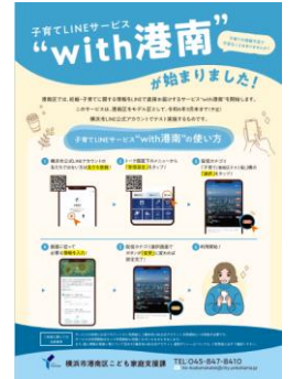
<“with港南”の案内チラシ>