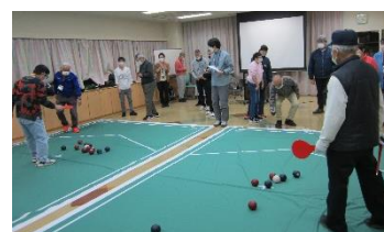
<ボッチャ交流会の様子>