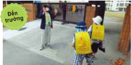
Đến trường Các con phải chú ý an toàn khi đi học đấy. A, có cô hiệu trưởng trông chừng rồi.

Các hoạt động được nỗ lực thực hiện để trẻ có thể yên tâm và bắt đầu sinh hoạt ở trường học (thời gian kết bạn)