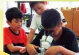
Kiến thức và kỹ năng

Tại Yokohama, chúng tôi mong muốn trang bị năng lực cho trẻ theo 5 quan điểm là: Trí (kiến thức về việc sinh tồn, làm việc), Đức (tâm hồn phong phú), Thể (thân thể khỏe mạnh), Công (tinh thần cộng đồng và tham gia vào xã hội), Khai (ý chí mở cửa tương lai). Chúng tôi đang thực hiện giáo dục với sự cân bằng và tương quan lẫn nhau giữa 5 quan điểm này.