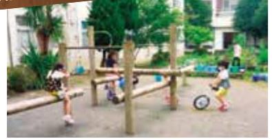
Có thể giao lưu với các bạn học lớn tuổi hơn (Hình ảnh tại một câu lạc bộ trẻ em sau giờ học)

Thời gian sau giờ học (Dự án giáo dục trẻ sau giờ tan học của thành phố Yokohama)