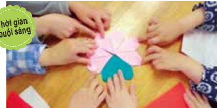
Thời gian buổi sáng Các con trở nên thân thiết hơn nhờ chơi trò xếp giấy Origami, rồi cùng sắp xếp chúng lại.