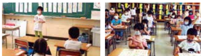
Thầy cô đã dạy con đọc, viết, và tính toán một cách rất cẩn thận.

Học với trọng tâm là các môn học, ... (Thời gian nhanh chóng)