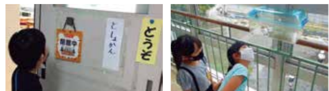
Ở trường có rất nhiều phòng học và có rất nhiều giáo viên. Con cũng được nhìn thấy nhiều loại sinh vật nữa. Con háo hức đi thám hiểm trường học đấy!

Học tập với trọng tâm là học về sinh hoạt (Thời gian mong đợi)