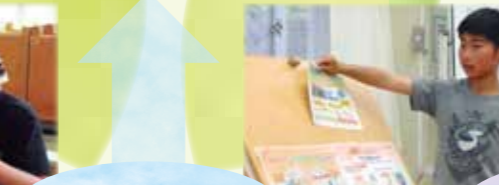
Năng lực hướng tới sự học hỏi, bản tính con người,...