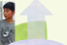
Năng lực tư duy, phán đoán, thể hiện,...