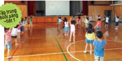
Tập trung buổi sáng - tiết 1 Các con cùng chơi "trò chơi nhìn dáng đoán chữ" và "trò chơi nhịp điệu" bằng cách vận động cơ thể thật nhiều ở phòng thể dục.