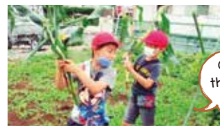
Con đã được đi thu hoạch ngô đấy.

Học với trọng tâm là các môn học, ... (Thời gian nhanh chóng)