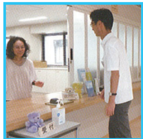
受付・待合スペース