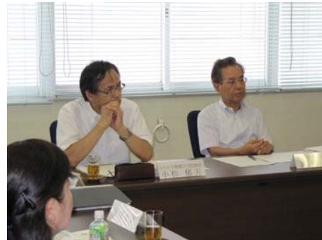
【学識経験者と教育委員との意見交換会】