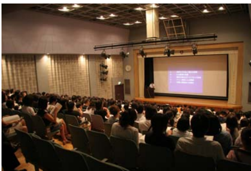
【南高等学校附属中学校学校説明会】

また、平成 23 年 1 月に策定した「横浜市教育振興基本計画」の市立高校における特色づくりを実施する計画として、 「横浜市立高等学校 教育振興プログラム」 を平成 23 年 3 月にまとめました（実施計画期間：平成 22 年度～26 年度）。本プログラムに基づき、市立高校各校のさらなる特色づくりと教育内容の一層の充実に取り組みます。