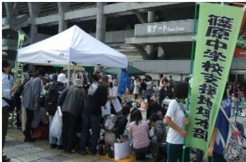
【地域コーディネーターの取組】