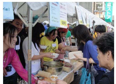
潮田交流プラザ秋まつり