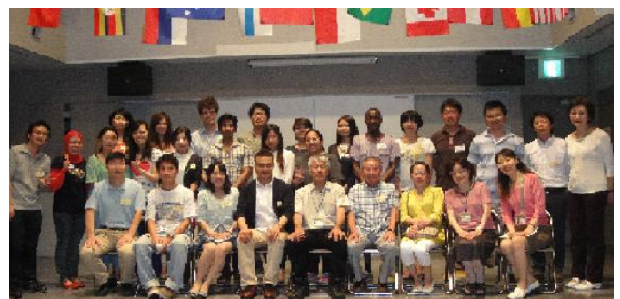
ベアーズのつどい (OB会)