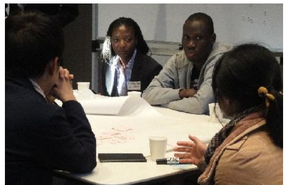
Rethinking Recycling with AIESEC