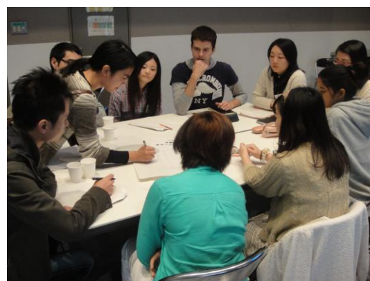
グループディスカッションの練習