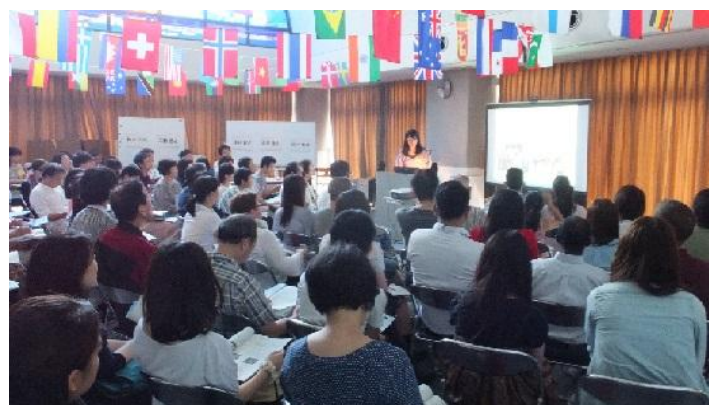
留学生と市民の井戸端フォーラム 2014 「考えよう！アフリカの水」