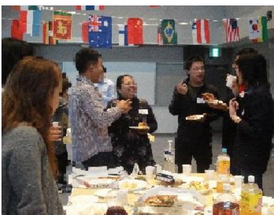
留学体験発表・交流会