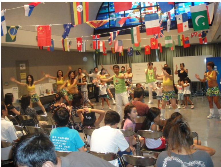
ブラジル総領事館交流イベント