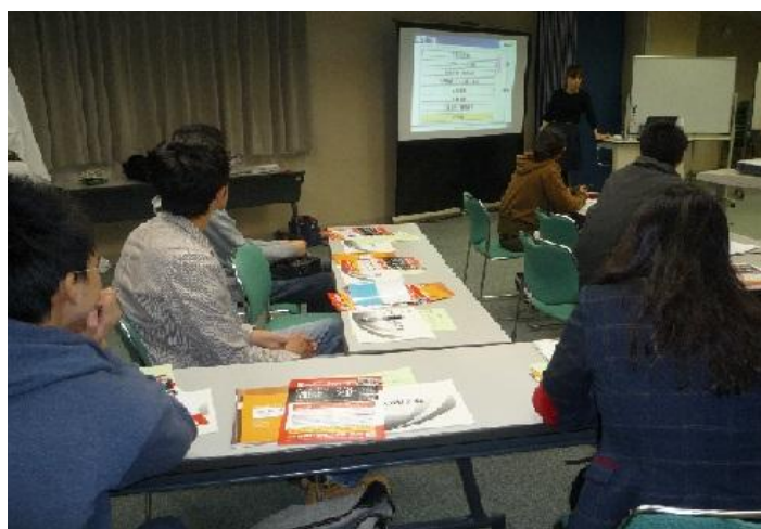
日本の業界徹底研究