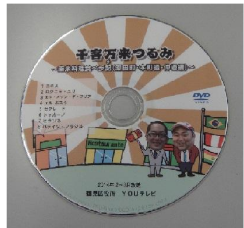
学生会館が紹介された YOU TV の番組が収録されている DVD 「千客万来つるみ」