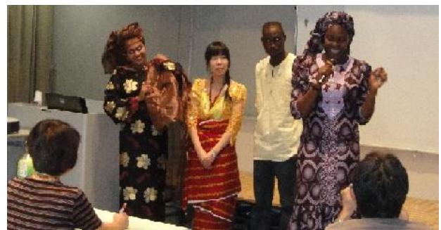
ナイジェリア文化講座