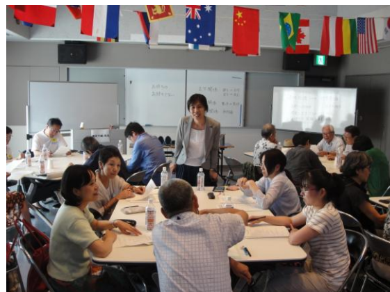
チューターのための指導法講座