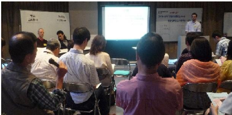
アメリカ・カナダ大学連合日本研究センターの外国人研究生による研究発表会