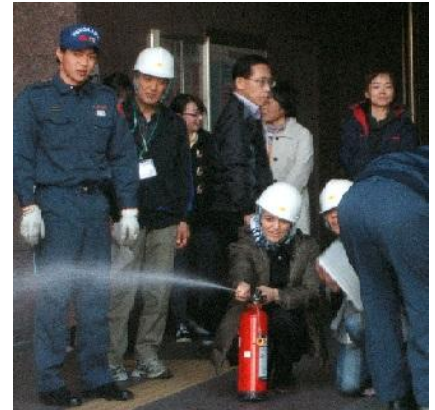
潮田交流プラザ合同避難訓練