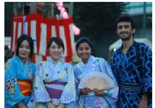
潮田西部地区連合盆踊り大会