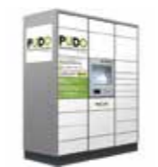
▲PUDOステーションイメージ(屋内型)

1月末に公営交通で初めて、オープン型宅配ロッカー「PUDOステーション」を、横浜・高田・東山田・中山の合計4駅に設置しました。 「PUDOステーション」は、提携する宅配事業者が共同で利用可能な宅配ロッカーです。自宅まで荷物を受け取ることができなかった際の再配達先として利用でき、通勤・通学の途中で荷物を受け取ることができるようになります。 利用方法や各駅の具体的な設置場所など、詳細は『横浜市交通局資産活用ポータルサイト』をご覧ください。