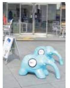
▲入口では「ペリコ」の愛称で親しまれる青いゾウがお出迎え! テラス内では、マンモスにも会える!

象の鼻カフェ ● 中区海岸通1 ☎ 045-680-5677 🕒 10:00~18:00 📅 年中無休 📍 横浜駅東口/桜木町駅から徒歩3分