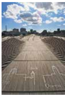
▲水面に浮かぶくじらのせなかのように!

大さん橋 ● 中区海岸通1-1-4 ☎ 045-211-2304 🕒 24時間オープン(屋上) 📅 年中無休 📍 桜木町駅からあかいくつ「大さん橋客船ターミナル」下車すぐ、横浜駅東口から26系統「大棧橋」下車徒歩3分