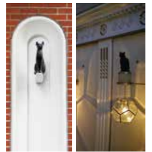
▲施設内のネココレクションは50匹以上! 探してみよう!

横浜生まれの作家で愛猫家でもある「大佛次郎」の記念館。自筆原稿などの様々な資料を、猫コレクションと共に紹介しています。