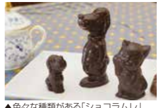
▲色々な種類がある「ショコラムレ」(左から犬小345円、犬大700円、猫540円)

三溪園近くのスイーツ店「ラ・ネージュ」には、犬や猫、熊など動物のチョコレートがあります。