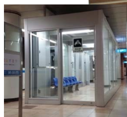
駅の冷房化 (踊場駅)