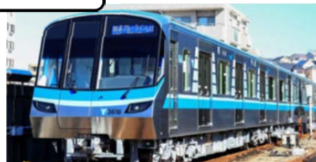
ブルーライン新型車両3000V形