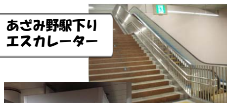
あざみ野駅下り エスカレーター