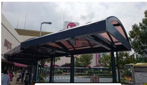
バスターミナル上屋 (港南台駅前)