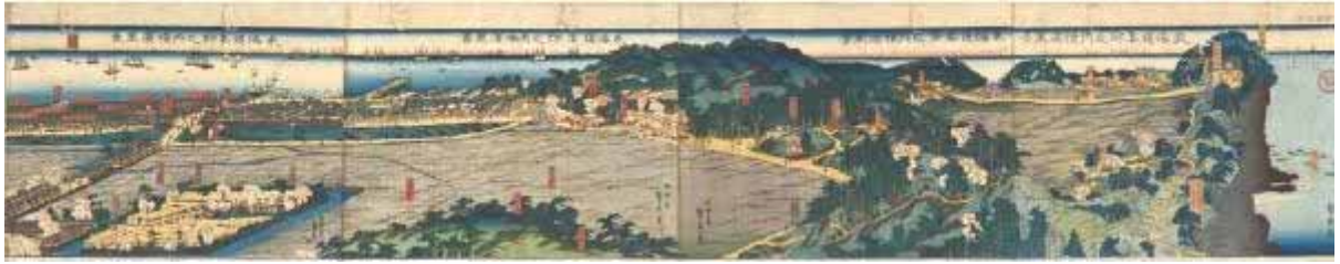
“Yokohama s Memory” Vol.4【1860年の横浜】より 横浜市中央図書館蔵