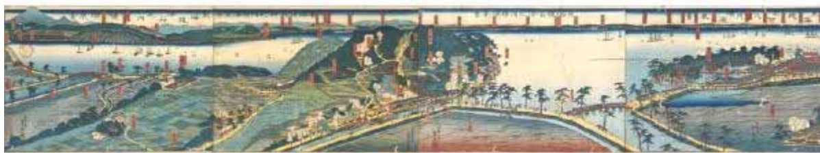
横浜浮世絵【五雲亭貞秀、東海道名所之内横浜風景、万延元年(1860)年、横8枚、小泉彫兼】