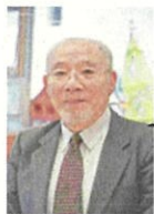
松見2丁目西部町内会 会長