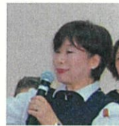
NPO 法人いこいの家夢みん 理事長

当団体もこれを機に協働にチャレンジしたくなりました。どの事業領域でも等しく可能性があることを感じていただきたいです。