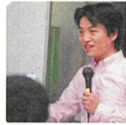
産業能率大学経営学部 准教授

今のまちをより住みやすくしたり、新しいつながりを創っていくため、各々が双方向で持ち味を発揮しやすい「協働」を積み重ねていきたいですね。