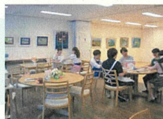
ザ・パークハウス戸塚1F ふらっとステーション・とつか

行政との対話、地域との対話を経て、横浜市に対しコミュニティスペース付（NPO 法人が運営）の集合住宅を提案。企業が考える地域と連携したプロジェクトづくりとは。