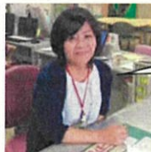
NPO 法人くみんネットワークとつか 職員

この分科会が地域の団体、企業、行政の方々の意見交換と気づきの場となり、それぞれが次の一歩を踏み出すきっかけとなりますよう！