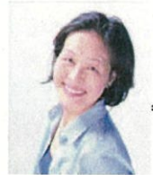
関内イノベーションイニシアティブ(株) 代表取締役

“協働”を難しく考えるのではなく、それぞれができる様々の形を見つけるきっかけになればと思います。