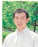
NPO 法人よこはま里山研究所 (NORA) 理事長