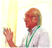
NPO 法人横浜プランナーズネットワーク