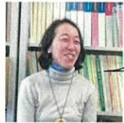
横浜市立大学大学院国際総合科学群 准教授

私たちの未来のために、協働を通して当事者それぞれの力をどのように活かすことができるのか、一緒に考えていきたいと思います。