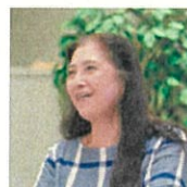
NPO 法人グリーンママ 理事長 新しい協働を考える会

市民活動、NPO 活動はココが肝！と思っています。皆さんと意見を交わしたいので、ぜひ一緒に！