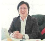
NPO 法人フェアスタートサポート 代表理事

セクターを超えてプロジェクトを進めるとき、協働の作法があると感じます。先行事例からたくさんヒントが得られるはず！