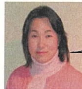
認定 NPO 法人市民セクターよこはま 理事・事務局長