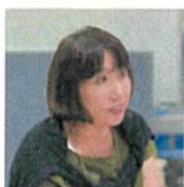
NPO 法人びーのびーの 理事 新しい協働を考える会

協働は、異質なもの同士の出会いと、お互いへの理解を深めるプロセスでゆえに、多少のストレスがつきもの。NPOにとっては社会や行政への提案・提言の場でもあることが多い。だからこそ気持ちがかよい合う“本音”の場に。