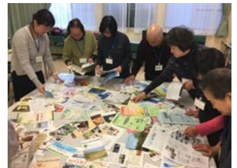
団体カスキルアップ講座 「心に届く広報紙の作り方」

⇒子育て支援拠点こっころ・区社会福祉協議会と3者連携で子育て応援講演会「日本の子どもたちはいま」（全2回）を実施しました。また、区内施設間連携促進及び地域支援の拡充を目的とした、区内施設職員・行政職員向け研修（全2回）を実施しました。