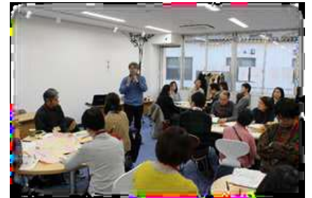
本から始まる出会いの場づくり講座