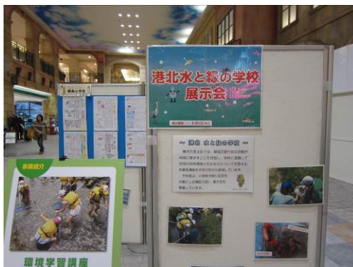
展示会（トレッサ横浜）の様子