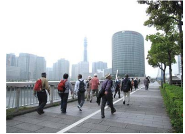
ウォーキングイベント