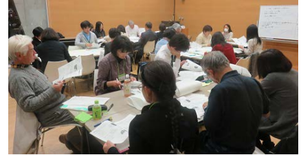
ワーキングの様子