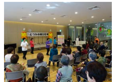
第7回とつかお結び広場

戸塚区内を中心に様々な分野で活動している地域活動団体や個人の活動内容を、パネル・活動体験・ステージパフォーマンス等を通して紹介するイベントを開催しました。企画・運営は公募で集まった運営委員の方々により行われ、来場者に地域活動への参加のきっかけを作ることや、活動団体同士の交流につながりました。