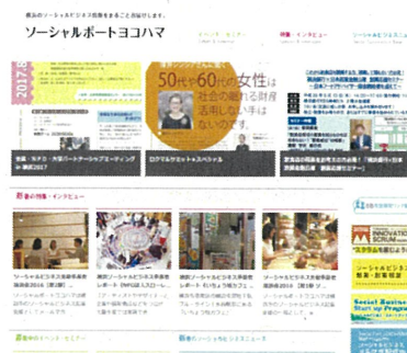
ソーシャルポートヨコハマ トップ

協働で実施することで、横浜市公式WEBサイト外での管理運営が実現し、官民含めた幅広い情報をリアルタイムで配信することで、SBに対する意識の底上げ及びSBでの起業がしやすい風土づくりを推進しました。