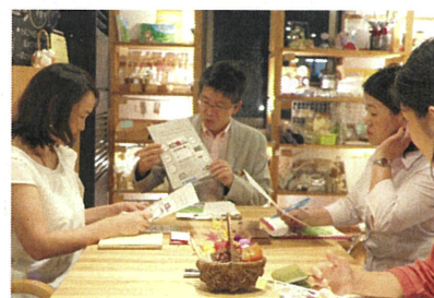
ソーシャルビジネス先輩事業者座談会 2016 【第1部 ソーシャルビジネス起業創業時の支援について】