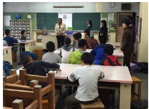
学校を核にした多文化事業

協働契約を締結することにより、お互いの強みを生かしながら、対等な立場で、相互に連携をとりやすくなりました。