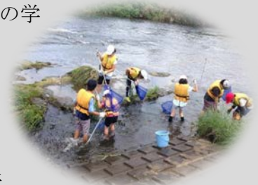
(一般向け講座 「慶應の森の探検隊」)

【効果】互いの持つ情報等を出し合い企画や広報を検討することで、自然の魅力を感じながら身近な防災について学ぶ一般向け講座を新たに行うなど、対象者の興味に合わせた事業を効果的・効率的に実施することができました。