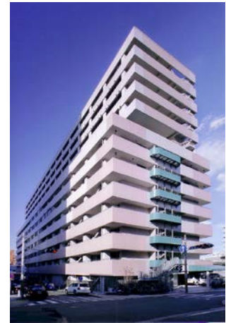
みなみ市民活動・多文化共生ラウンジ外観

市民活動、生涯学習活動及びボランティア活動並びに外国人市民、外国人コミュニティ及び国際交流機関の支援を通して、市民の理解と参画のもとに、市民力の向上と豊かな地域、異なる文化や生活習慣への理解を深める交流の拠点づくりを図るため、市民公益活動等のネットワーク化・相談対応・活動の場の提供、外国人市民に対する相談対応・情報提供・情報発信を行っています。