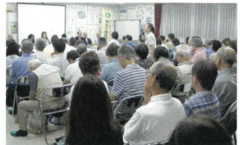
「地域のつどい」の様子