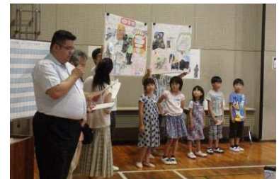
一次コンテスト発表の様子