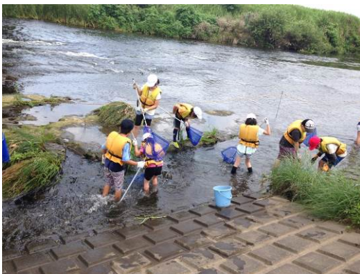
小学生向け講座での魚とりの様子