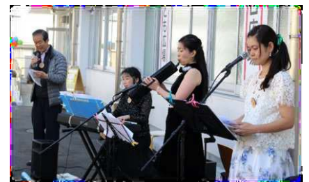
「街の名人・達人」によるコンサート