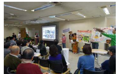
二次コンテスト発表の様子

市民活動支援の実績があるNPO法人と協働することで、コンテストなどにおいて活動する市民に寄り添った運営ができました。また、それぞれの団体のネットワークを生かすことで、効果的な広報を実施することができました。