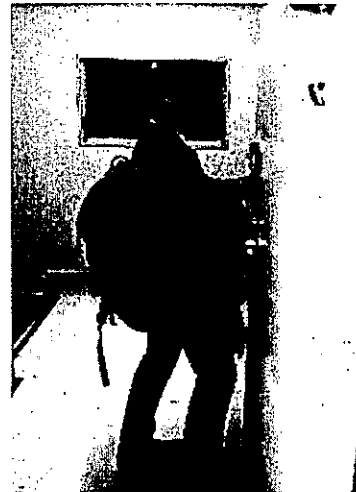
昨年度のかばん持ちの様子

ワークだけでは補いきれない経験知の部分を昨年から協力いただいている各団体の代表や事務局長に話を聞き、座談会もしくはコラム形式としてまとめる。