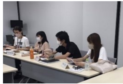
実行委員会の会議の様子