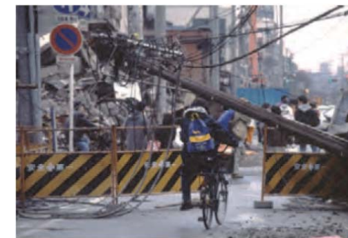
阪神・淡路大震災(平成7(1995)年1月)

平成28年12月に施行された「無電柱化の推進に関する法律」第8条に基づき、本市においても無電柱化を推進するため、基本方針、期間、無電柱化の推進に向けた施策等を定めた「横浜市無電柱化推進計画（素案）」を作成しました。市民の皆様からご意見をいただき、平成30年度内に計画を策定します。