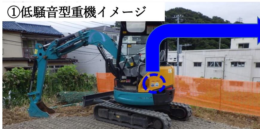
① 低騒音型重機イメージ