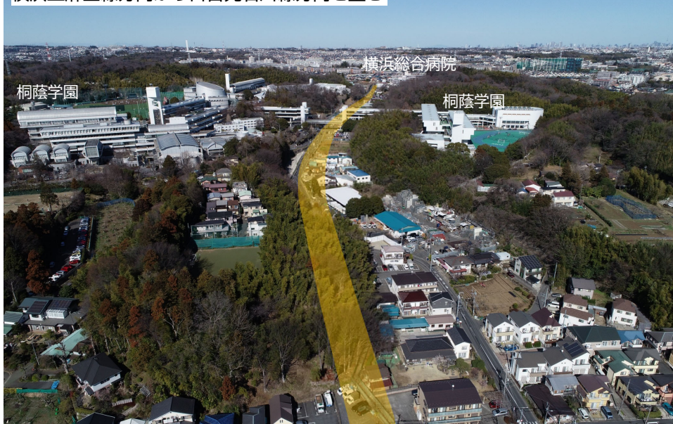
横浜上麻生線方向から日吉元石川線方向を望む