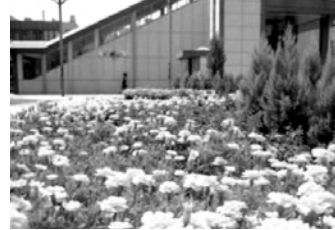
花いっぱいの野外ギャラリー