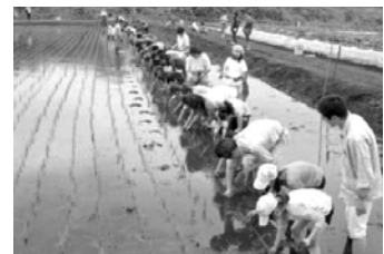
親子で田植えを体験

地元農家及びJA横浜青壮年部の協力により、農作業体験（米、野菜）と収穫物の試食会等を実施し、自然や農業の大切さを身近に感じてもらいました。