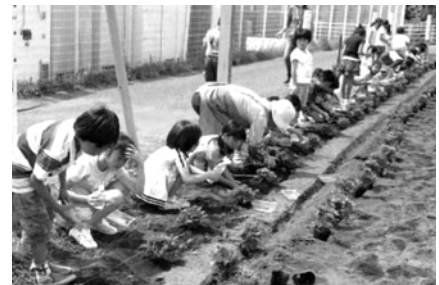
上飯田地区花植えの様子(6月6日)

地域への愛着を高めるため、上飯田地区と下飯田地区で、自治会・町内会が小学校と協働で通学路や駅前花だんなどに季節の花を植え、魅力あるまちづくりを推進しました。