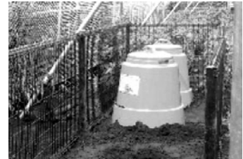
コンポスト容器30世帯で実施

区民が地域の空き地に生ごみコンポスト容器を設置し、生ごみを堆肥化。できあがった堆肥は育苗モデル事業等で活用しました。