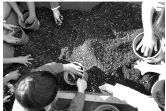
区内小学校での出前講座による植え

また、区内小学校2校（植えの出前講座の実施）、保育園3園、高校1校、区民1名が育ての親として協力中です。