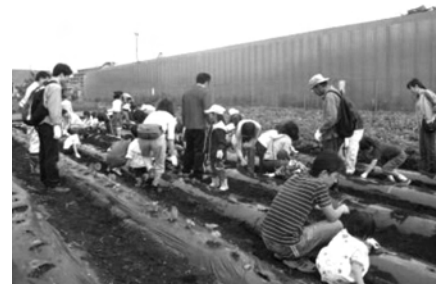
ふれあい農園(5月19日)

19組・75人の親子が参加し、「ふれあい農園」で、農業生産者の指導を受けながら種まきや苗植えなどを5月から2月にかけて6回実施しました。農家との交流を図りながら親子で農業を体験することで、農業への関心・知識・理解が高まりました。