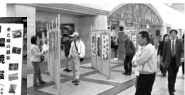
パネルを熱心に見る来場者