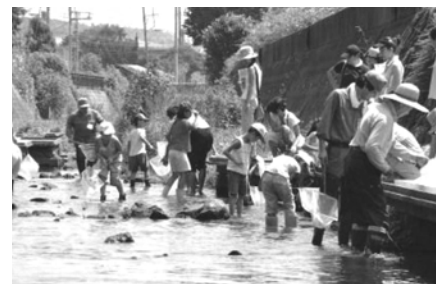
阿久和川開催時の様子(8月21日)

泉区の地域資源である豊かな水環境を生かし、環境意識の高揚を図るため、和泉川と阿久和川で、区内小学生を対象に生物観察や水質実験を行う「川の環境学習」を実施し、自然環境への理解を深めました。(合計2回)