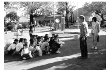
愛護会の方の話を熱心に聞く児童

区内小学校の児童が「せやキッズあいごかい」（公園愛護会「こども版」）として活動を進め、公園の使い方などの公共マナーの啓発を行いました。また、中学校の生徒も夏休みに公園で公園愛護会と共に清掃活動を行いました。