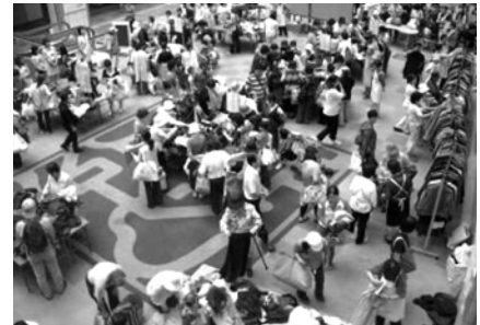
衣服のリユースの様子(7月6日)

消費生活推進員と協働して、「衣類のリユース」を区役所で2回、地域で13回実施しました。区民の意識が高まり、参加者が前年度と比較して288人増加(1,756→2,044人)するとともにリユース率が前年度と比較して8.5ポイントと大幅に向上(70.4→78.9%)しました。