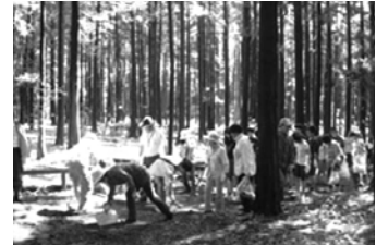
市民の森で間伐材 チップを頒布

連合町内会・環境団体・区内企業・行政が連携して、きれいな街瀬谷の実現をめざして、一斉清掃を実施しました。