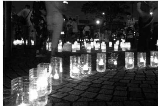
キャンドルナイト in さかえ2007夏の様子

電気を消して生まれる、ゆったりとした時間の中で、キャンドルを灯し、地球環境について考えたり、ライフスタイルについて見つめ直してみようと呼びかける「キャンドルナイト」イベント（ライトダウン及びキャンドル点灯、ミニコンサートなど）を、JR本郷台駅前で開催し、約2,500人の来場がありました。