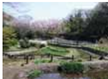
生物多様性に配慮した公園