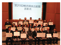
横浜環境活動表彰式