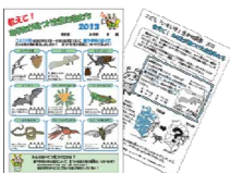
小学生生き物調査 調査票