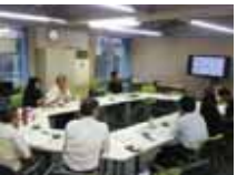
産学民間連携共同研究