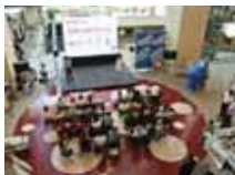
環境行動フェスタ