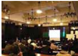
職員事例発表会の様子

・横浜市 ISO 環境マネジメントシステムへ反映することにより、区局ごとの「環境行動目標」作成や取組・成果の共有化を行い、率先行動を推進します。 ・事例発表、研修会、研究会等により「現場の知恵」の集約を進めます。