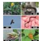
陸域生物調査の調査項目