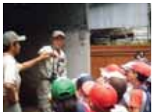
金沢動物園での環境教育