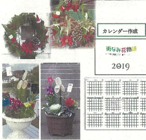
菅田地区センターまつりで掲示・PR