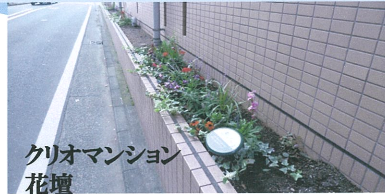
クリオマンション 花壇