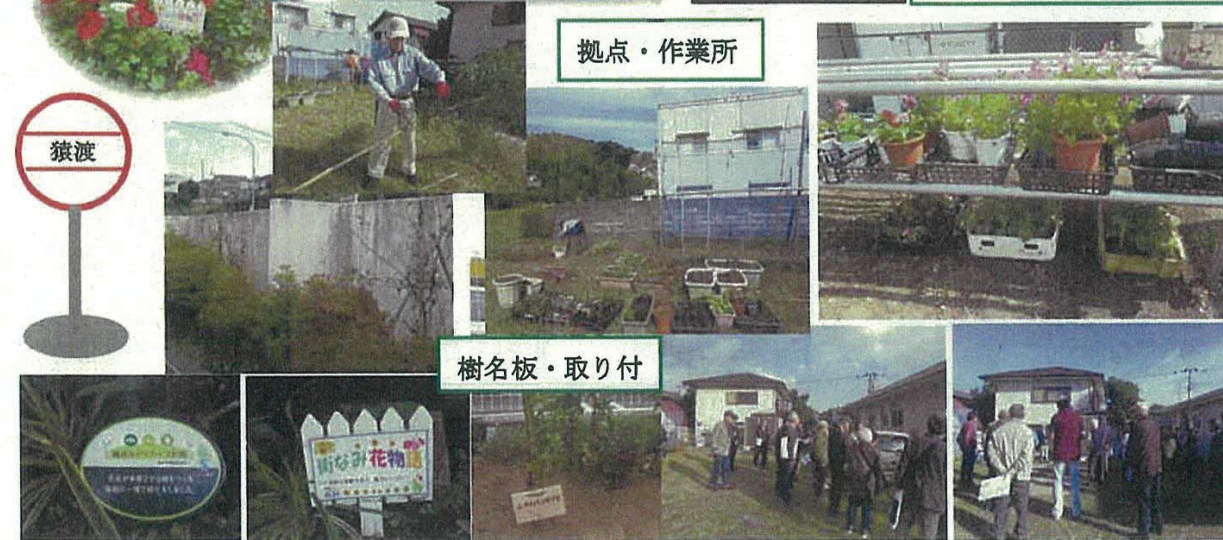
ミニ看板作成・取り付