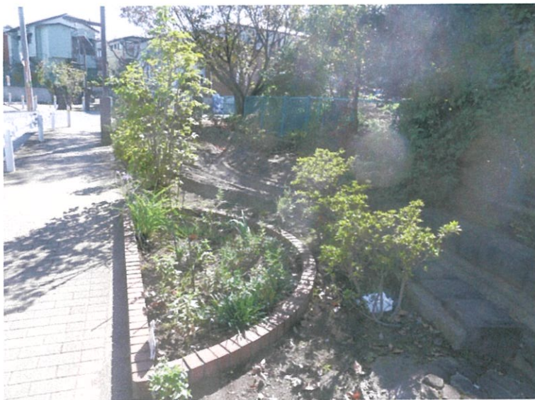
● 猿渡バス停：せせらぎ花壇植栽