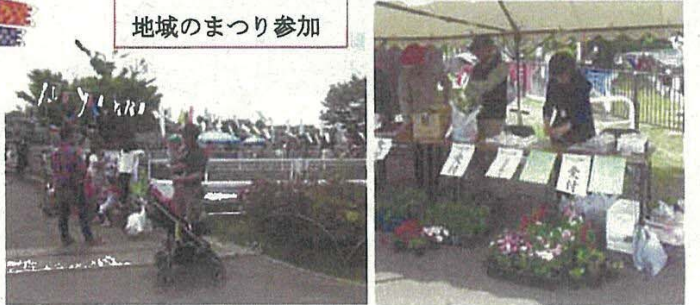
地域のまつり参加