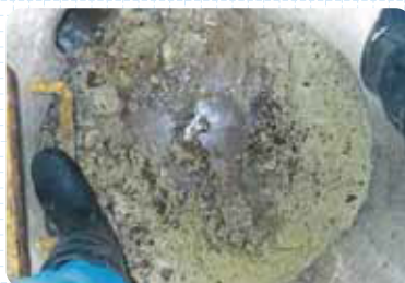
人孔部油脂類による閉塞状況