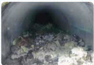
管路部油脂類による閉塞状況

油脂類を直接下水管に流すと、 油が冷えて固まり、下水管等の詰まりの原因 になります。 下水管等の詰まりにより、 道路や敷地などに汚水があふれ出る可能性 があります。 (原因者として、法令による罰則や損害賠償請求などを受ける場合があります。)