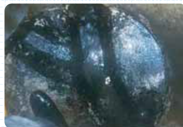
清掃後の人孔状況

下水管について定期的な 点検・清掃等維持管理を行っていますが、 油脂類を下水管に流さないよう 皆様の協力が必要となります。