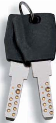
図2 再生水利用キー