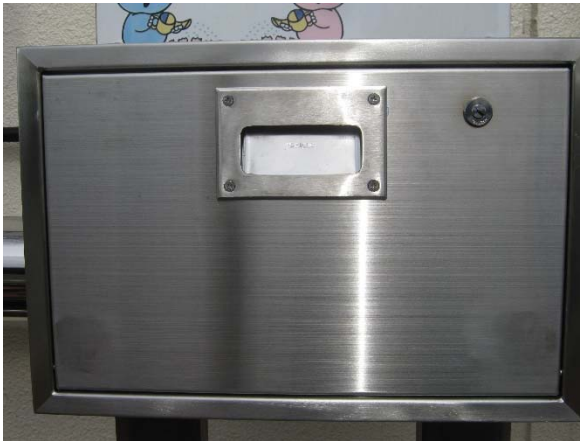
図1 バルブボックス