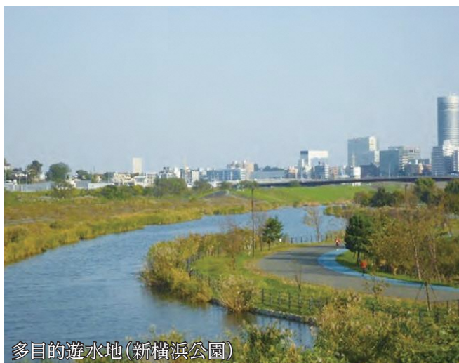
鶴見川水系 (市内延長)