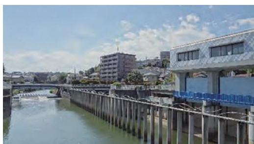
▲帷子川分水路入口