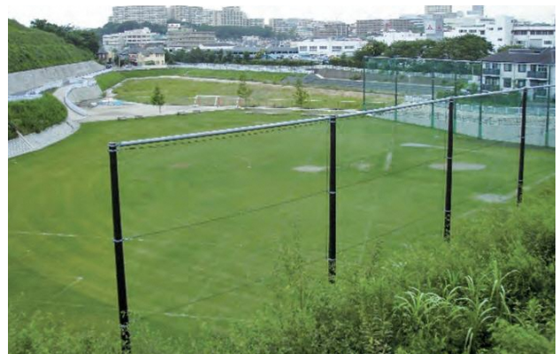
▲平戸永谷川遊水地