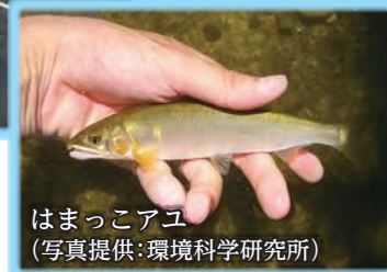
はまっこアユ