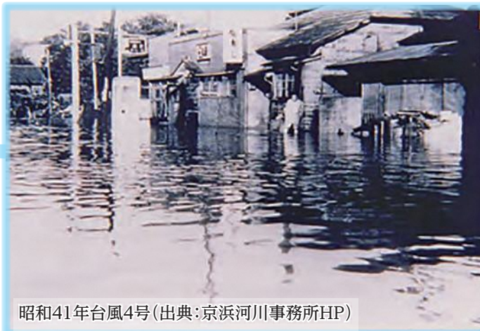
昭和41年台風4号(出典:京浜河川事務所HP)

このように緊急の課題であった治水については、一定の成果を上げています。しかし、気候変動による集中豪雨や大型台風の発生が頻発化する傾向にあるため、今後も河川改修を着実に進めていくとともに、大雨を一時的に貯めるための雨水調整池の設置などによる総合的な治水対策を進めていくことが必要です。