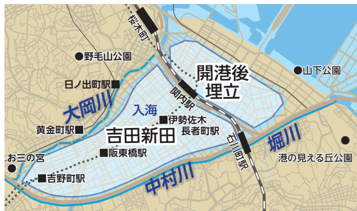
▲現在の地図と重ねた図