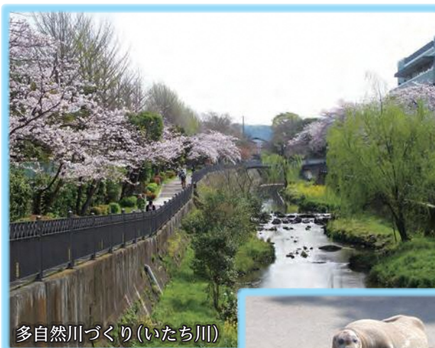
多自然川づくり(いたち川)