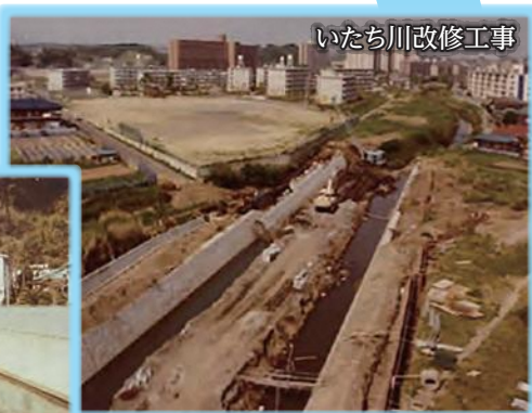
いたち川改修工事