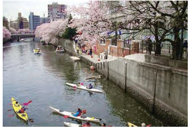
▲大岡川桜栈橋（利用の様子）