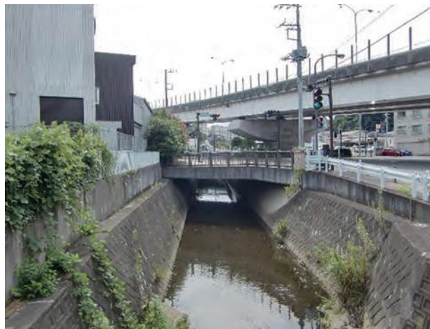
▲環状2号線との交差点