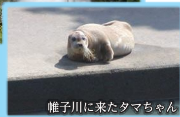
帷子川に来たタマちゃん