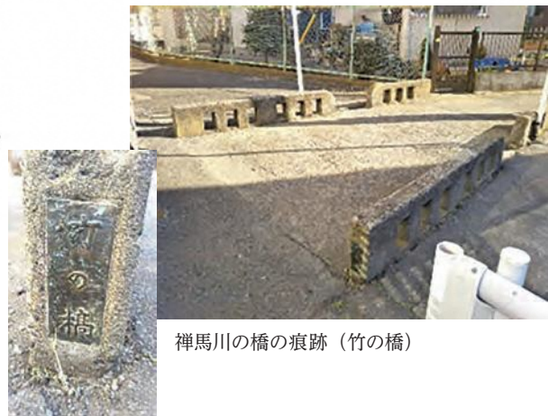
禅馬川の橋の痕跡（竹の橋）

かつて、久良岐公園付近を源流として磯子小学校の脇を流れ磯子・海に見える公園付近で海に注ぐ「禅馬川」が存在しました。上流区間や支川でなく、水系そのものがなくなったのはこの川だけです。昭和54年に準用河川の役目を終えて、今は道路や下水道として市民の生活を支えています。流路が残るのは下流の一部のみですが、橋の痕跡など今も昔の川の流れを感じる遺構があります。