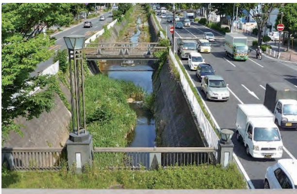
▲環状2号線と並走する上流部

中流部には平戸永谷川遊水地があり、洪水時に水を貯めるほかに、平常時は野球などができるグラウンドとして活用されています。