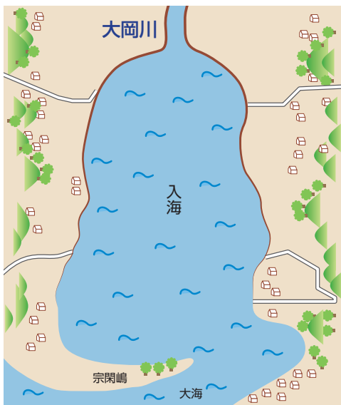
▲吉田新田埋め立て以前