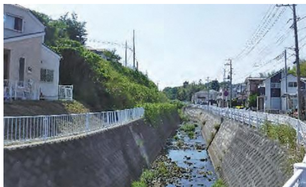
▲住宅地を流れる中堀川