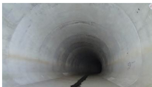
▲帷子川分水路のトンネル内部