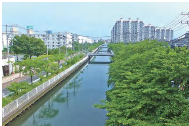
▲住宅地を流れる宮川