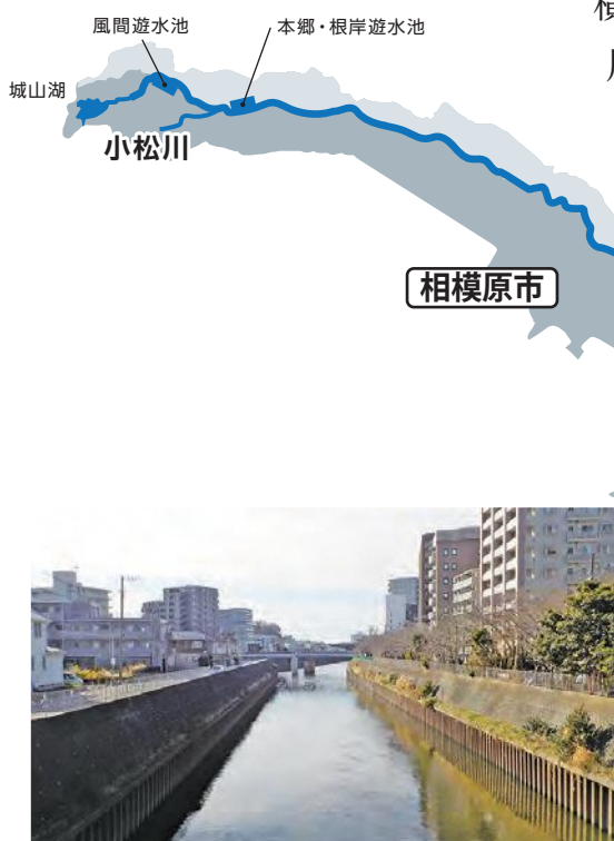
▲ 柏尾川合流点付近

横浜市内で境川へ合流する川は、相沢川、和泉川、宇田川です。また、阿久和川、名瀬川、平戸永谷川、舞岡川、いたち川は柏尾川に合流したあと、藤沢市内で境川に合流します。