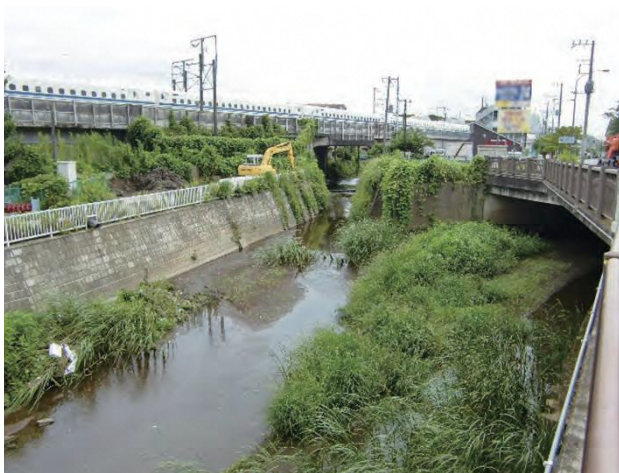
▲砂田川合流点付近