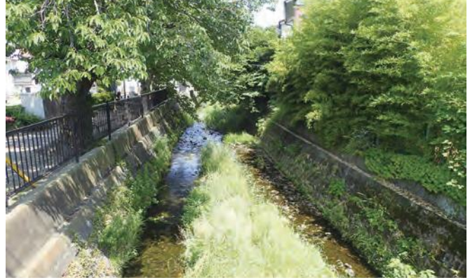
▲侍従川上流