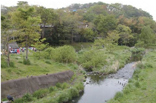
▲ 稲荷森の水辺(いたち川)