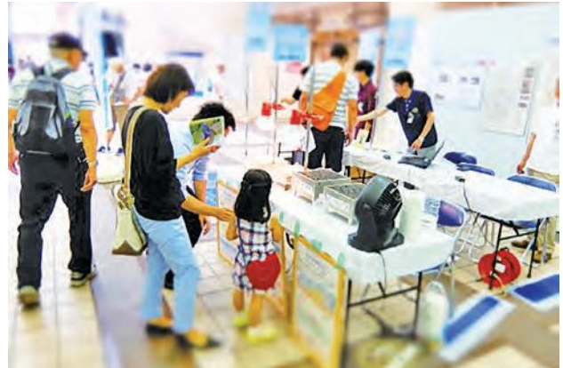
▲透水性舗装実験などの展示