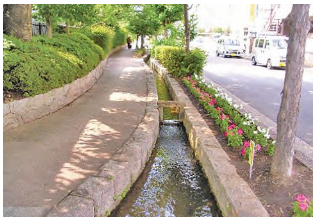
▲ 浄念寺川せせらぎ緑道

市街地において、下水道の整備に伴い水辺が失われる場所にせせらぎを再生し、同時に緑道を併設する事業です。せせらぎに流れる水は、近隣の湧水や地下水などのほか、水再生センターで通常よりもきれいに処理された再生水などが水源となっています。