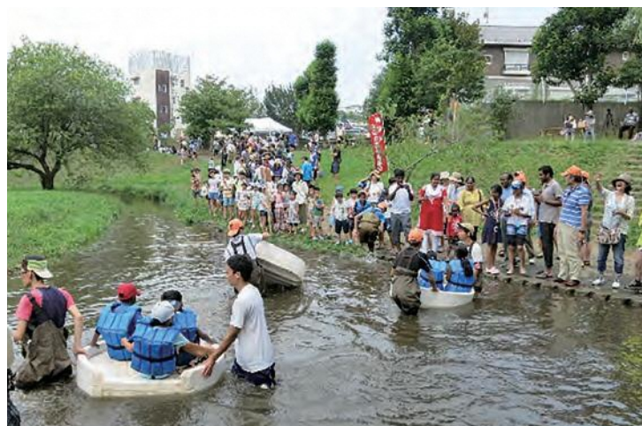
「こども川の日」の様子 ▶

毎年7月には、梅田川一本橋メダカひろばで、協議会主催の「こども川の日」を開催しており、水辺の自然を活用した遊び・学びを通じて、子供たちの健やかな成長を育むとともに、水辺を中心とした地域の連携を図っています。