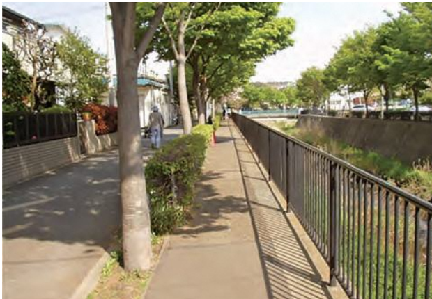
▲ 川辺の散歩道(いたち川)

また、河川改修に伴い発生する旧川敷の豊かな自然環境を活用し、散歩道や水辺空間として整備しています。