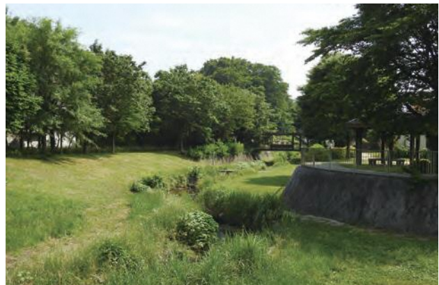
▲ ニツ橋の水辺(和泉川)