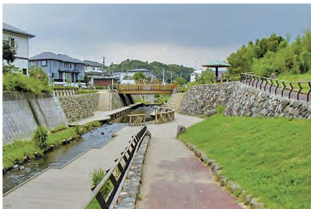
▲ 集いのまほろば(阿久和川)

河川周辺に病院や老人ホームなどが近接する地域に、障害者や高齢者でも川に親しめるような「すべての人に優しい川づくり」を進めるため、護岸の緩斜面化、堤防坂道の緩スロープ化、休憩施設の設置などを実施しました。(平成5年度に阿久和川で事業採択)