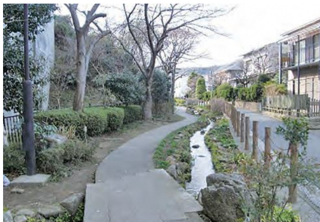
▲ 釜利谷町小川アメニティ

川の源流付近の自然の景観が残されているところで、水の流れを活かしながら、周辺環境との調和に配慮した散策路等を整備した事業です。自然石を配置するなど、ホタルなどの水生生物や湿地を好む植物の生息環境に配慮し、源流域の小川の姿を再現しています。