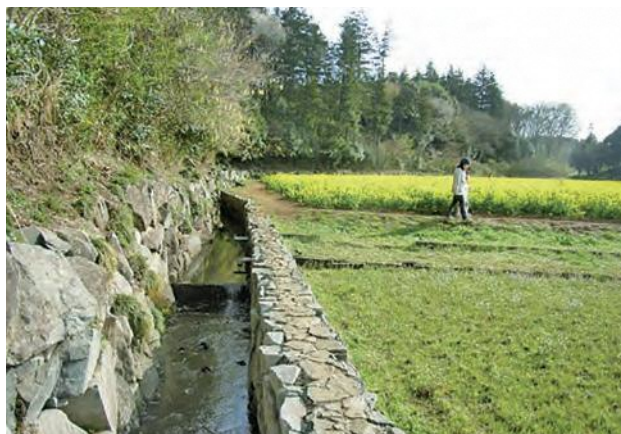
▲ 矢指町小川アメニティ