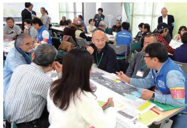
▲ ワーキングの様子