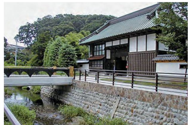
▲ 憩いのまほろば(阿久和川)