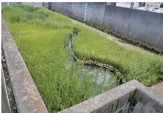
▲ ビオトープの環境(黒須田1号雨水調整池)

平成4年度から21年度にかけて、市内47箇所の雨水調整池に、生物生息空間(ビオトープ)を整備しました。市街地における貴重な自然環境であり、周辺の自然環境に生息する生物が、雨水調整池ビオトープを經由し、他の地域に生息域を広げられるよう、自然ネットワークの形成を図ることなどを目標としています。湿地・水辺の植生、開放水面の広がり、多様な生物の生息環境となり、水鳥やトンボ等の昆虫類も飛来します。近所の小学校の生徒を対象にした観察会を行っている施設もあります。