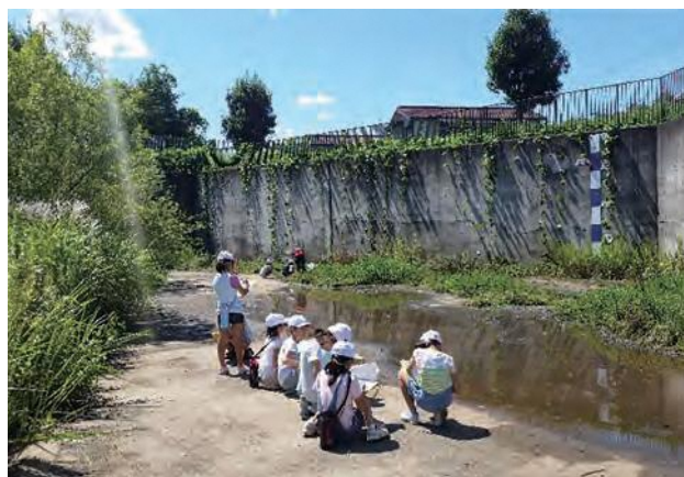
▲ 小学生との自然観察会(森の台1号雨水調整池)