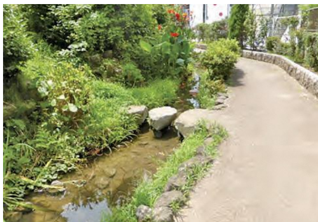
▲ 飯島町せせらぎ緑道