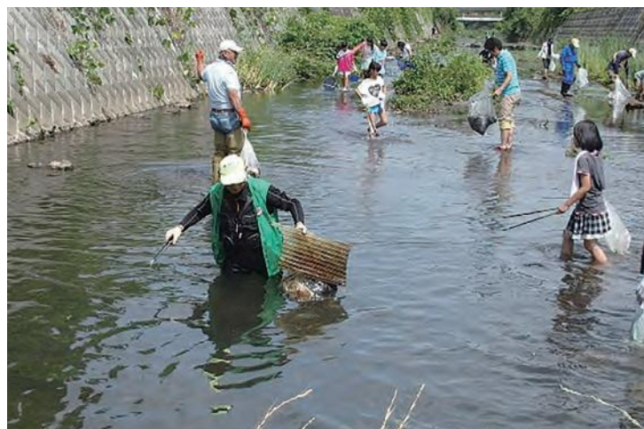
愛護会活動の様子(帷子川) ▶

現在、河川や小川アメニティ、せせらぎ緑道などを対象に100近くの団体が活動しています。最近では生き物観察会といった水辺施設を活用した自主的な活動やイベントを実施する団体もあります。