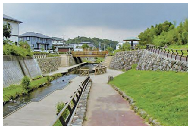
▲ 集いのまほろば(阿久和川)

河川周辺に病院や老人ホームなどが近接する地域に、障害者や高齢者でも川に親しめるような「すべての人に優しい川づくり」を進めるため、護岸の緩斜面化、堤防坂道の緩スロープ化、休憩施設の設置などを実施しました。(平成5年度に阿久和川で事業採択)