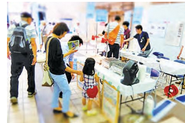
▲透水性舗装実験などの展示