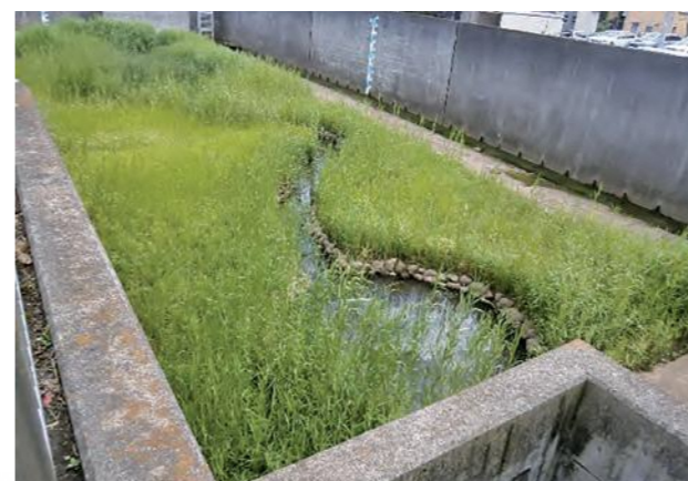
▲ ビオトープの環境(黒須田1号雨水調整池)

平成4年度から21年度にかけて、市内47箇所の雨水調整池に、生物生息空間(ビオトープ)を整備しました。市街地における貴重な自然環境であり、周辺の自然環境に生息する生物が、雨水調整池ビオトープを経由し、他の地域に生息域を広げられるよう、自然ネットワークの形成を図ることなどを目標としています。湿地・水辺の植生、開放水面の広がり、多様な生物の生息環境となり、水鳥やトンボ等の昆虫類も飛来します。近所の小学校の生徒を対象にした観察会を行っている施設もあります。