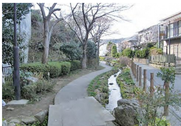
▲ 釜利谷町小川アメニティ

川の源流付近の自然の景観が残されているところで、水の流れを活かしながら、周辺環境との調和に配慮した散策路等を整備した事業です。自然石を配置するなど、ホタルなどの水生生物や湿地を好む植物の生息環境に配慮し、源流域の小川の姿を再現しています。