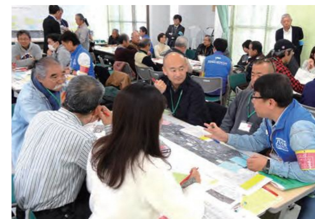
▲ ワーキングの様子