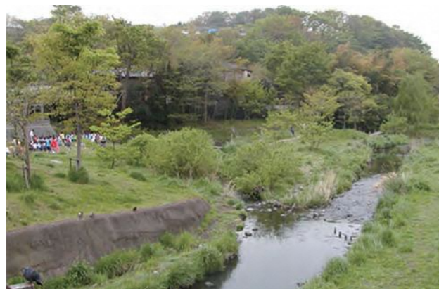
▲ 稲荷森の水辺(いたち川)