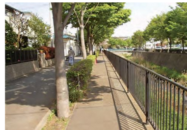
▲ 川辺の散歩道(いたち川)

また、河川改修に伴い発生する旧川敷の豊かな自然環境を活用し、散歩道や水辺空間として整備しています。