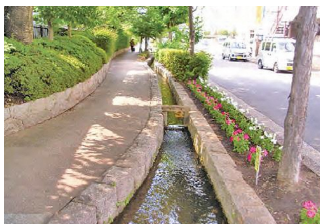
▲ 浄念寺川せせらぎ緑道

市街地において、下水道の整備に伴い水辺が失われる場所にせせらぎを再生し、同時に緑道を併設する事業です。せせらぎに流れる水は、近隣の湧水や地下水などのほか、水再生センターで通常よりもきれいに処理された再生水などが水源となっています。