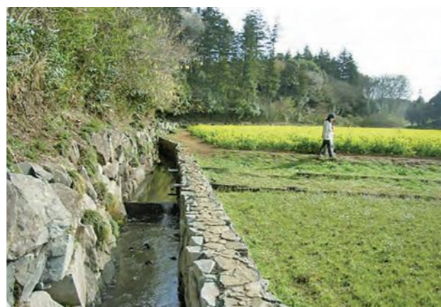
▲ 矢指町小川アメニティ