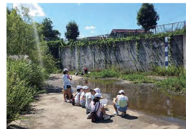
▲ 小学生との自然観察会(森の台1号雨水調整池)