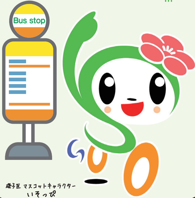
磯子区 マスコットキャラクター いそっぴ