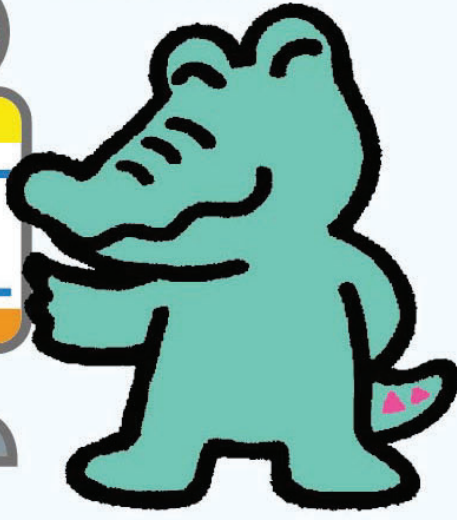
鶴見区 マスコットキャラクター ワックン