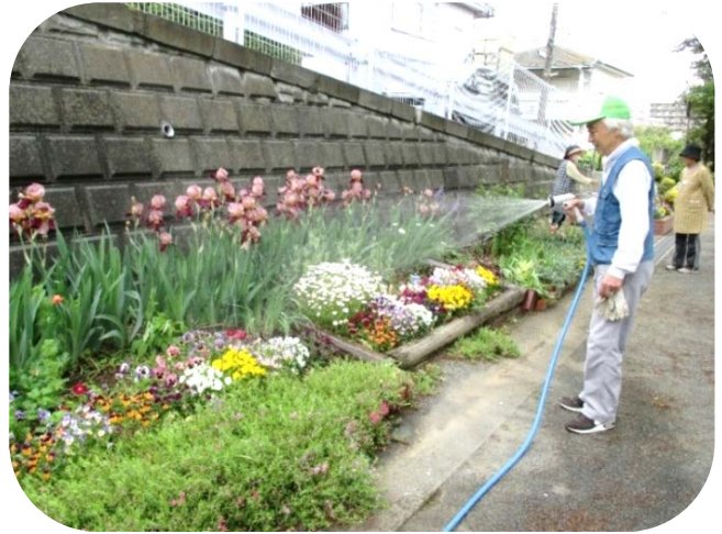
花壇での水やりは交代で行います

道路沿いの小さな十ノ区公園。ここの花壇には、一年草だけでなく、たくさんの宿根草も植えられています。活動を行う花クラブでは、作業を「花壇担当」「花木担当」に分担しています。夏の水やりは、一週間交代でみんなが行うなど、自然と協力する体制ができています。花が咲くのをとても楽しみに活動しています。