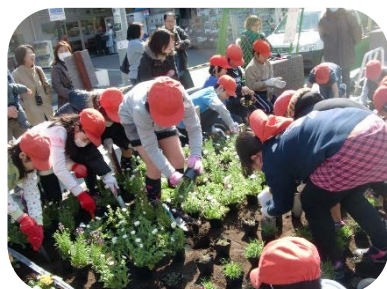
活動には 40 人もの子どもが参加します (写真は小学校との合同花植えの様子)