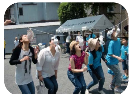
パン食い競争は大人も一緒に参加