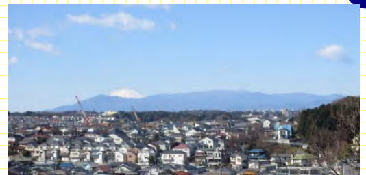
大山や丹沢の山々と富士山

また、「ぶた公園」の愛称で呼ばれている公園でもある。ぶたの遊具は、昭和のはらっぱ公園の時代から、改修や再整備を重ね、位置を移動しても、変わらずにあるらしい。