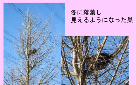
冬に落葉し 見えるようになった巣