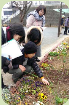
花一つ一つについて丁寧に解説

回覧板で、花壇の手入れを行う「花クラブ」メンバーを募集しました。はじめは「義務」と思っていた人も、自分の育てた種が成長し、立派な花を咲かせる様子を見て、参加する楽しみを見出しています。今では 30 人を超える人たちが花クラブとして活動しています。