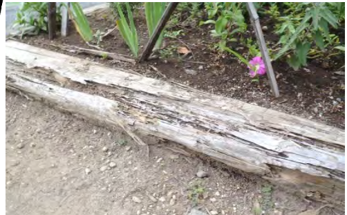
腐食した花壇枠の例

技術支援などで設置した木製の花壇枠は、年数が経つと腐食し、金具が飛び出るなど危険です。また、使われなくなってしまった花壇枠の撤去や「花壇の手入れ講習」の技術支援も可能です。土木事務所・公園緑地事務所等に相談してください。