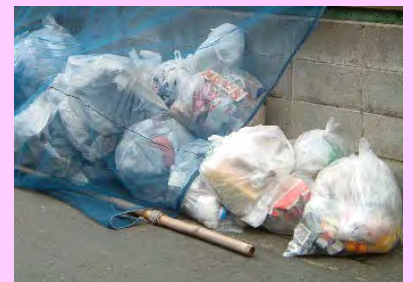
ゴミ出しの悪い例（ネットから出ている）

カラスは、鳥にしては体も大きい方ですが、人よりずっと小さな生き物です。このため、何もなしに人を襲うことはありません。人を襲うのは、子育ての時期に、子どもを守ろうとする行為です。守ろうとする原因がなければ、人がたくさんいても襲うことはありません。もし、襲われたら、近くにヒナが居たか、巣があったと思われま。不要なトラブルを避けるため、なるべく近づかないようにしましょう。