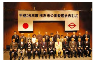
平成28年度の表彰式の様子

★表彰式は、環境創造局の「みどりアップ月間」である10・11月中に開催予定です。