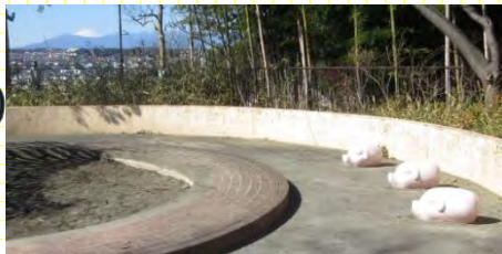
砂場を見守るぶたと富士山