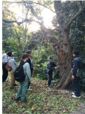
職員向け研修も実施しています

幹や根元が腐っていないか、腐朽の原因となるキノコの発生がないかを中心に点検を行っています。点検の結果、倒木の危険性が高いなどと判断された樹木は、順次、伐採や植え替えなどの対応を進めています。