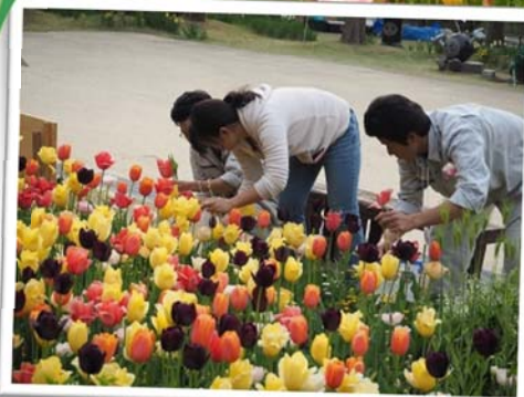
ミックス球根ワークショップでの様子 (浜名湖花博2014・静岡県立農林大学校)