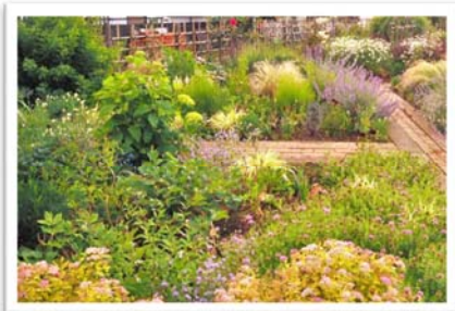
左から、3月初旬・4月上旬・5月中旬でのミックス花壇の様子（東京農業大学グリーンアカデミー）