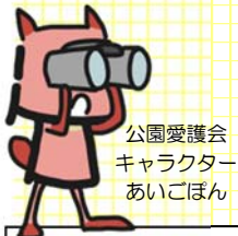
公園愛護会 キャラクター あいごぼん

ここは、中区山手町の学校に囲まれた公園「キリン園」。ブランコとすべり台のあるごく普通の小さな公園だ。