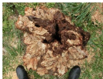
根元に大きな腐朽がみられた事例