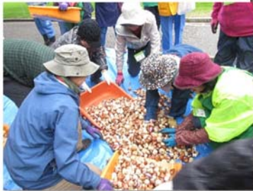
約8万球の球根をミックスし、土の上にはばまきます。

山下公園での球根ミックス花壇づくり実作業の様子です。 11月14日には、最後の植え付けが終わり、 あとは開花を待つのみです。