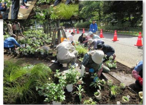
多年草の植え付けの様子 道具の使い方を教わり、1球ずつ丁寧に植えつけます。