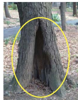
開いた空洞部の例