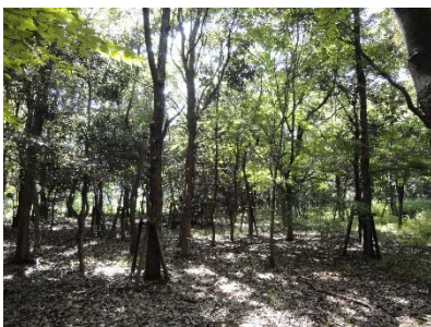
樹木間の距離が近い場合など新しい樹木を植えない場合もあります。

横浜市では、腐朽の程度や樹木周辺の状況から、倒木の危険性を判断しています。判断にあたっては、専門家（樹木医）の意見を聞くことがあります。