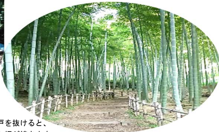
ばじょうじ谷戸を抜けると、 竹林の緩やかな坂が続きます