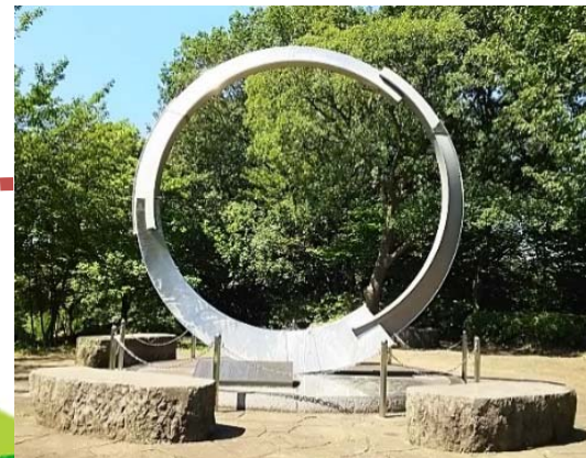
展望広場にそびえ立つ港北ニュータウン記念モニュメント

月1回程度で開催される「クラフト体験教室」。子どもだけでなく、大人も本格的に楽しめる内容になっています。