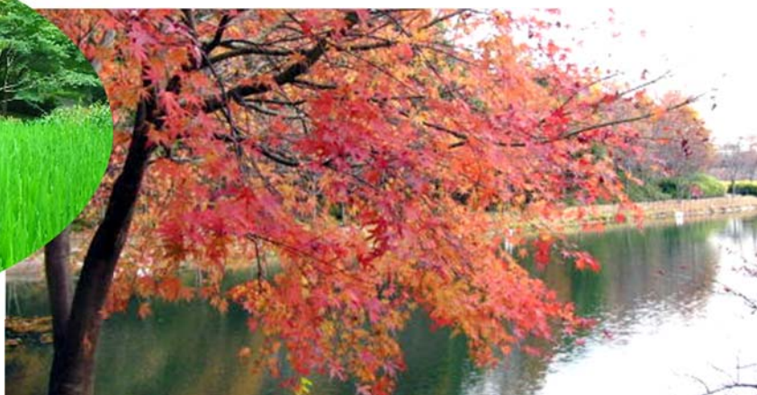
宮谷戸（みやと）大池近くのイロハモミジの 紅葉は必見です