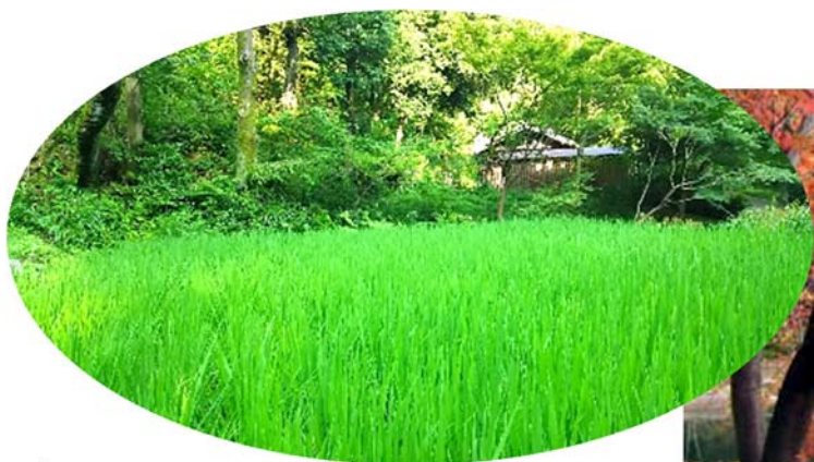
ばじょうじ谷戸の水田 四季で様々な表情を見せます