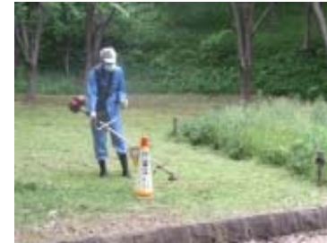
桜広場の草刈作業