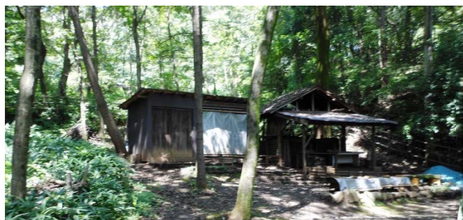
炭焼き施設「宮谷戸（みやと）窯」の様子 イベントなどでにぎわいます