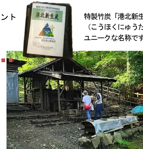
特製竹炭「港北新生炭(こうほくにゆうたうん)」ユニークな名称です