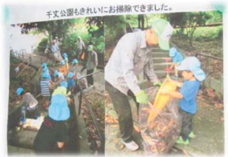
↑保育園との活動を写真で報告

掲示板設置をきっかけに、愛護会の中で 広報部 を結成し、貼っています！ これから毎月1回ずつ、広報部会を開く予定です。