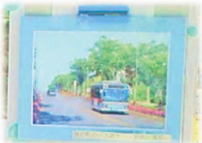
↑地域の方が撮影した公園前の写真