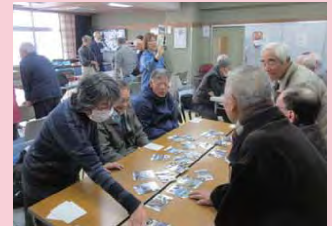
かるたをしながら西区内の公園を回った気分になります