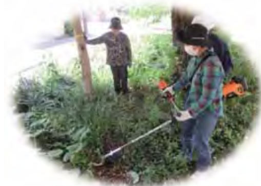
瀬谷区三ツ境第二公園愛護会の草刈機の安全講習の様子

横浜市では、公園愛護会の皆様が行う草刈りは、安全に配慮して手刈りを基本としています。しかしながら、草地の面積が広い場合など、手刈りが難しい公園では、希望する愛護会へ草刈機の安全講習の実施と講習受講後に草刈機の貸出を行っています。従来貸出している燃料式の2枚刃の草刈機は、エンジンの始動が難しい、音や振動が大きいといった声がありました。充電式の2枚刃の草刈機は、バッテリーを取付けて、周囲の安全を確認し、ハンドルを握ると動きます。これまで草刈機の使用は難しいとあきらめていた団体も作業に取り組むことができます。今後は、用途に合わせて、燃料式と充電式の2枚刃の草刈機の貸出を行います。秋以降の講習や貸出のご相談については、各事務所へお問い合わせください。