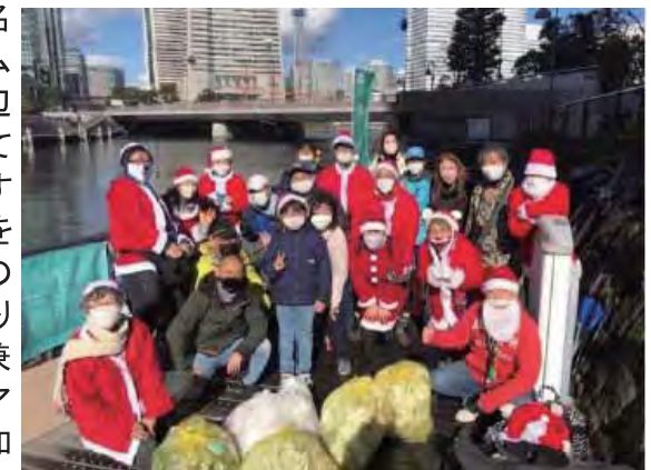
クリスマスの公園清掃イベントの様子

当愛護会は、平成28年4月より活動を始め、現在会員数は14名です。活動では、観光都市横浜のみなとみらい地区を望む水辺プロムナードで結ばれた北仲通北第一、第二、第三の3つの公園と公園周辺の清掃に加え、公園を利用した地域交流イベント等を積極的に行っています。観光客も多く訪れる場所であることから週1回の清掃は欠かすことはできません。また、新しい住民の多い地域であることから、公園を利用した地域交流イベントも盛んに行っています。イベントでは、公園の正面にそびえるランドマークタワーを日本一のやぐらに見立てた盆踊り大会や盆踊りを彩る提灯づくりのワークショップ、さらに防災訓練を兼ねた炊き出し訓練や焼き芋大会、キャンドルヨガの開催などアイデア溢れる企画を行い、地域の住民同士の結びつきを大切に活動に加え、にぎわいの創出にも尽力しています。