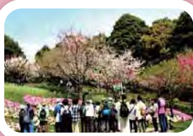
里山ガーデン花壇講習会の様子

ガーデンネックレス横浜の取組として春と秋に行われる里山ガーデンフェスタでは、大花壇を楽しむことができます。2027年に横浜市で開催されるGREEN×EXPO 2027に向けて、栄区の公園愛護会の皆さんと里山ガーデンで、花壇の維持管理などを学ぶ講習会を行いました（令和7年4月10日）。「花の植え方や配置が参考になった。」「たくさんの花の名前がわかった。」などの感想をいただきました。春の穏やかな気候の中、サクラやハナモモの花も満開で美しく、自然との一体感をしみながら学びました。