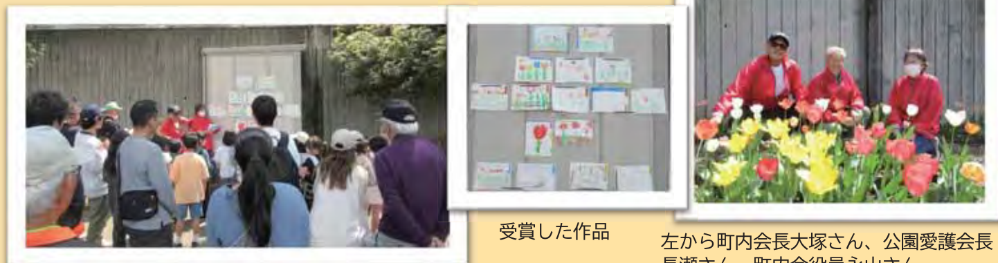
おまちかねの受賞作品がいよいよ発表です