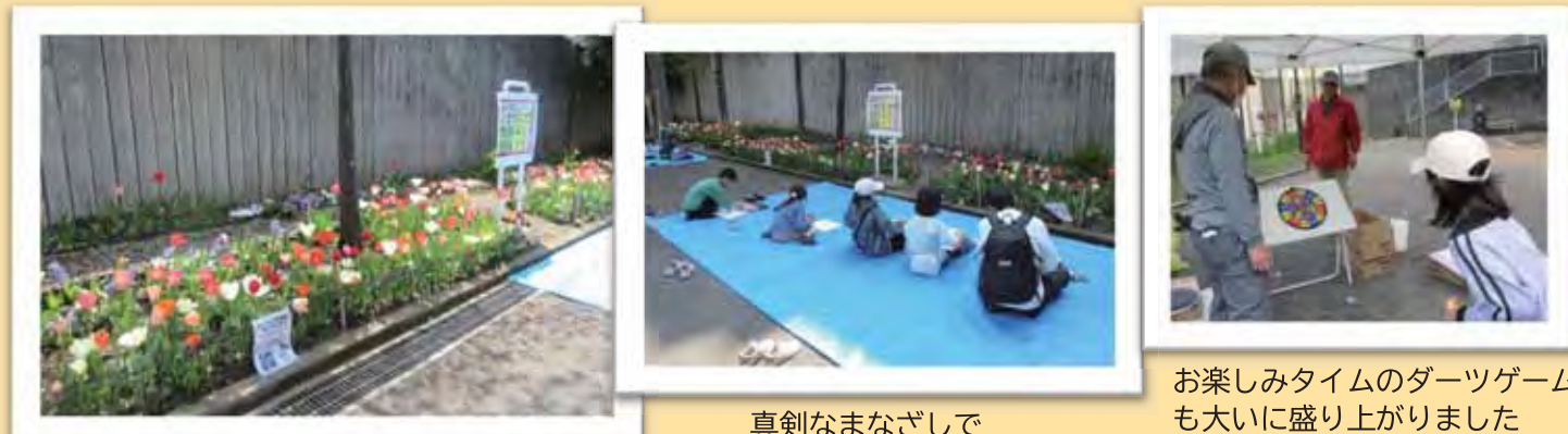
見事に咲き誇ったチューリップ花壇

このイベントは、師岡打越町内会と師岡打越第二公園愛護会がいつか避難場所の公園を知ってもらうため、町内会や公園愛護会の活動を知ってもらうために企画して、今年で7回目になります。イベント開催のために去年の夏からチューリップ球根を注文して、10月に町内会と公園愛護会のメンバーで植え付けをしました。主催者からは「今年は、お天気がよく、チューリップが一番見頃な時にイベントができて、大成功でした。」とお話しを聞きました。表彰作品は、公園愛護会掲示板で紹介されているのでぜひ見てください。