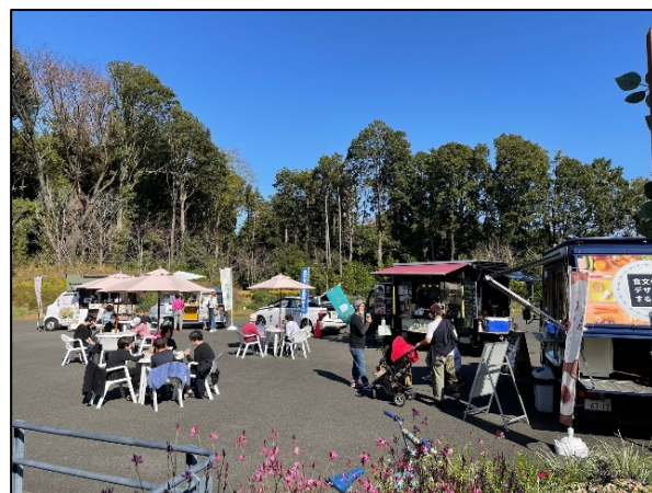
キッチンカーの展開イメージ